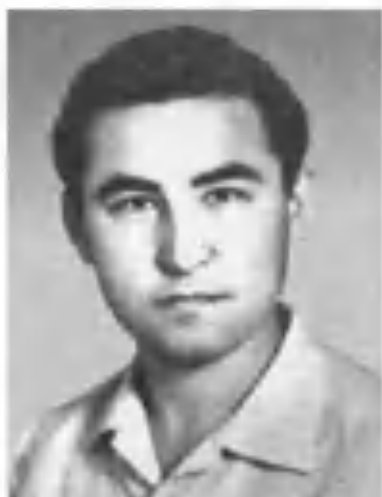
Муҳаммад Али. Тошкент, 1972.