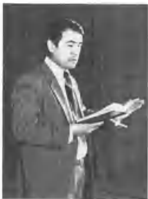
Муҳаммад Али адабий кечада шеър ўқимоқда. Тошкент, 1978.