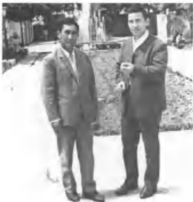
Муҳаммад Али дўсти шоир Тўлан Низом билан. Тошкент, 1968.