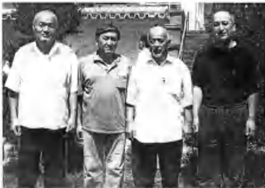
М. Маъмуров «Косонсой» сиҳатгоҳида