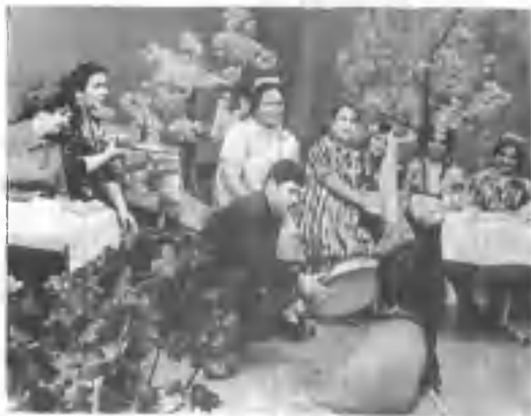
«Наврӯз» байрамига бағишланган ойнаи жаҳон курсагуви