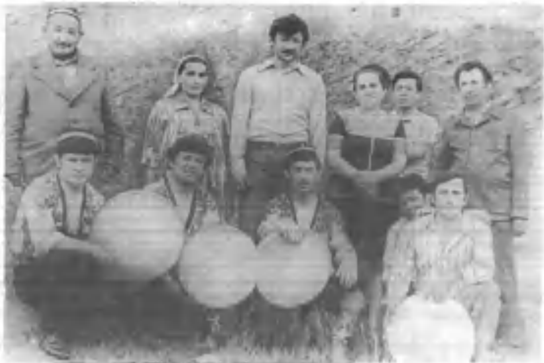
Ака-ука Исломовлар жаҳон чемпиони Руфат Рисқиев билан