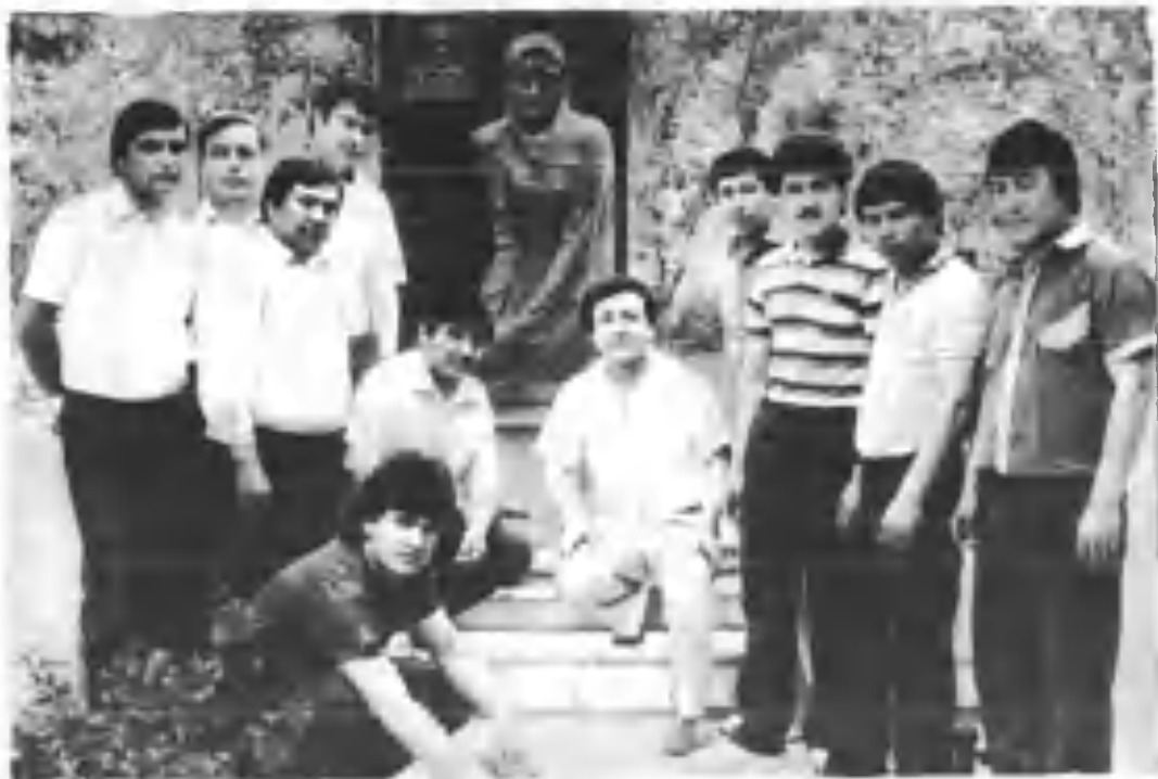
Она ҳайкали қошида