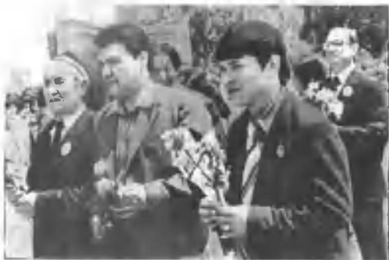
Озарбайжонда Ўзбекистон адабиёти ва санъати кунлари