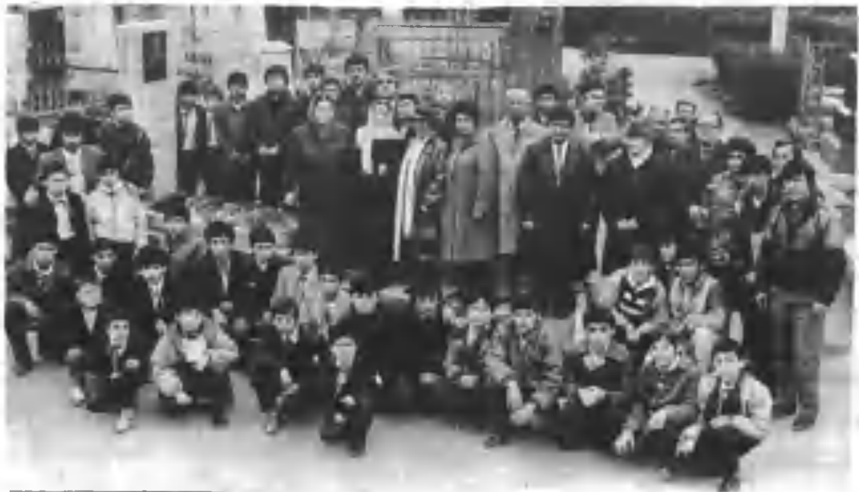
Уста Олим Комиловга ёдгорлик ўришилган пайт