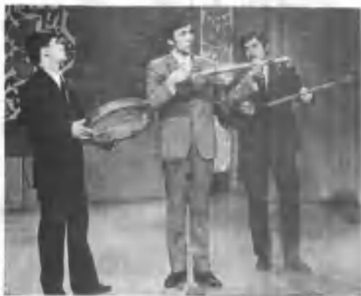
Ўзбекистон халқ артисти Аҳмаджон Шукуров билан