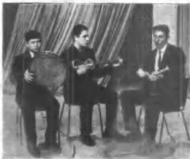
Дилмуроднинг қўқонлик хонадалар билан ойнаи жаҳон орқали чиқиши