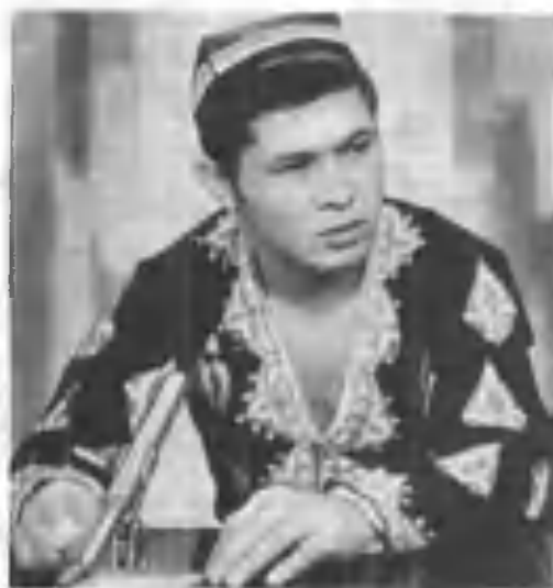
Телекўрсатувларда чикишлардан бири