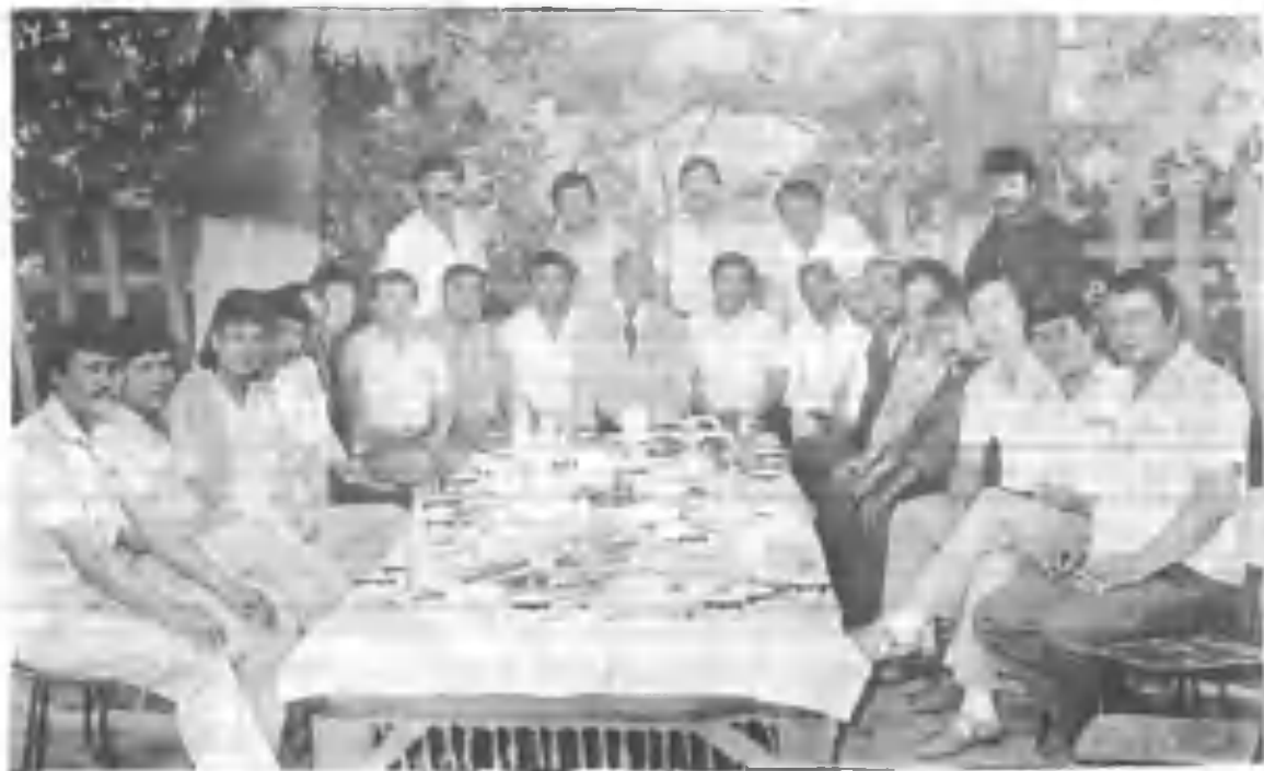
Устоз ва шогирдлар давраси