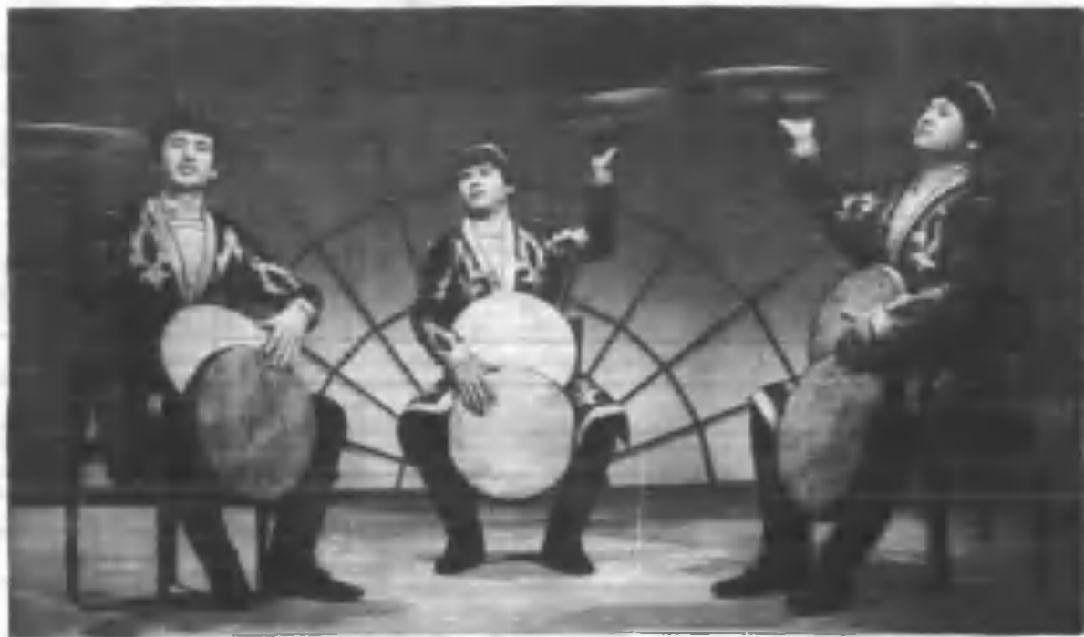
Кубадаги XI Жаҳон фестивали лауреатларининг чиқиши