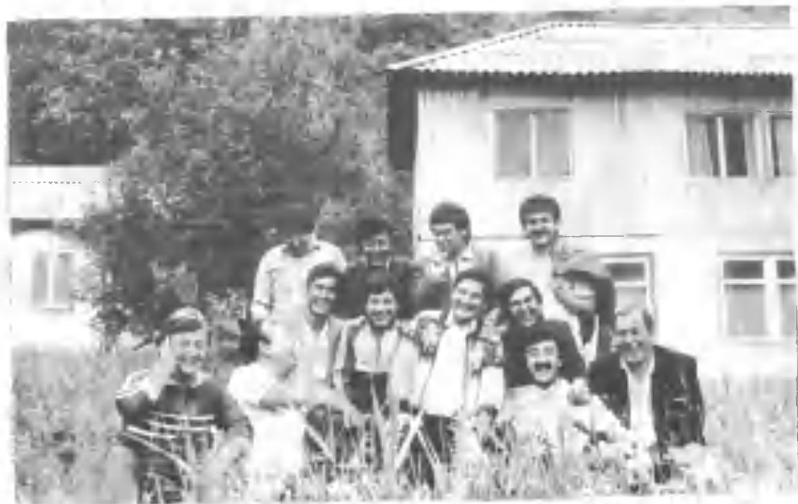
Доирачилар дам олиш масканида