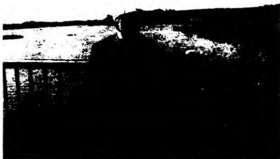
Қозоғистон.Тобул дарёси бўйида.