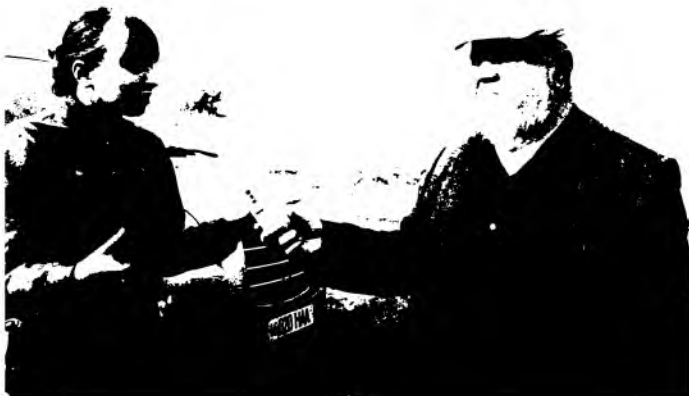
Экспедиция, 2012 йил, октябрь. Волгоград вилояти (Россия). Дубовка шаҳри четидаги қадимги Белжамин, ҳозирги Водян археологик ёдгорлик жойи.