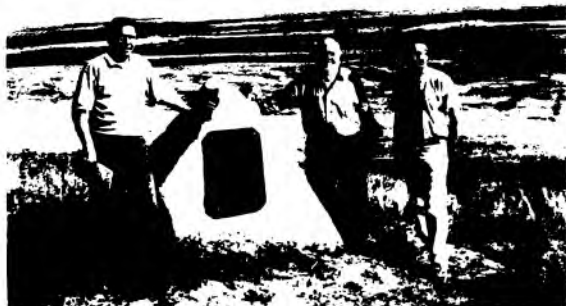
Россия.Красний Яр тумани. Амир Темур лашкаргоҳига ўрнатилган ёдгорлик тоши.