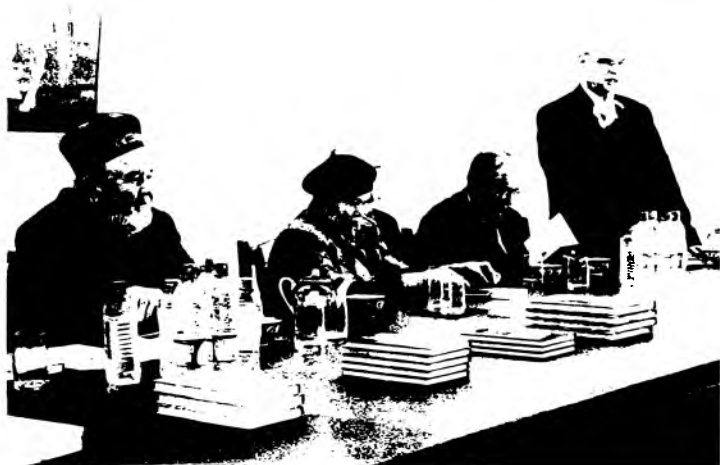
Янги нашр этилган Бобур мавзуйдаги китоблар муҳокамаси.