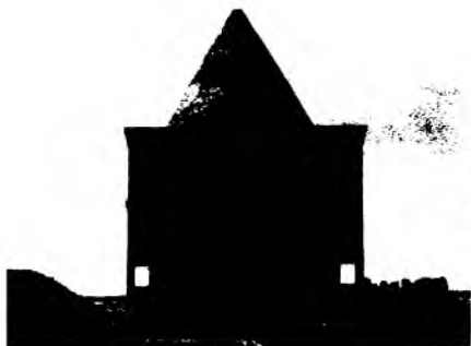
Россиянинг Варна туманида жойлашган Амир Темур минораси.