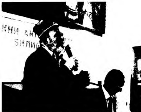
Бобур таваллудининг 525 йиллигига бағишланган халқаро конференцияда.