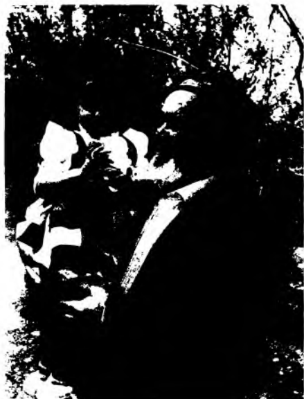
Ўригидан мағизи ширин...