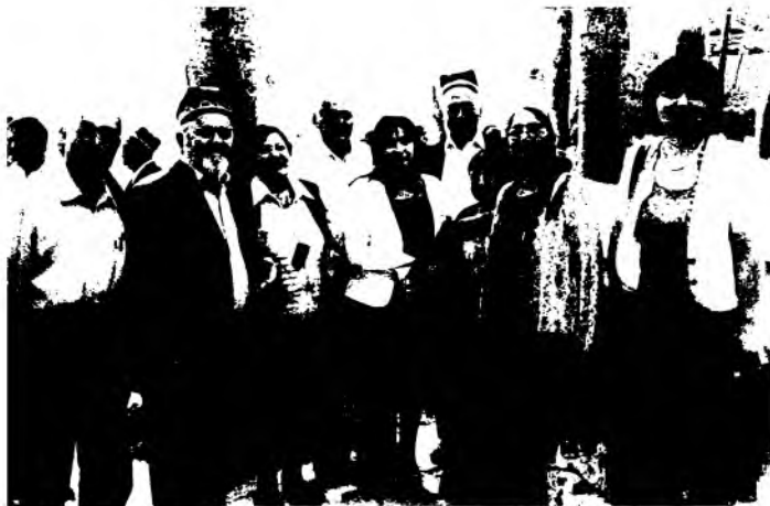
Андижондаги Бобур кунларига бағишланган маданий тадбирлардан бирида.