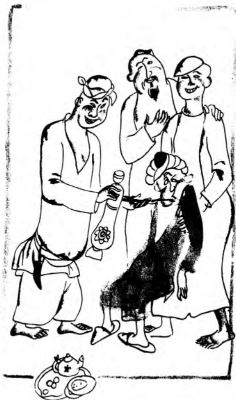
«Калвак Махзумнинг хотира дафтари»