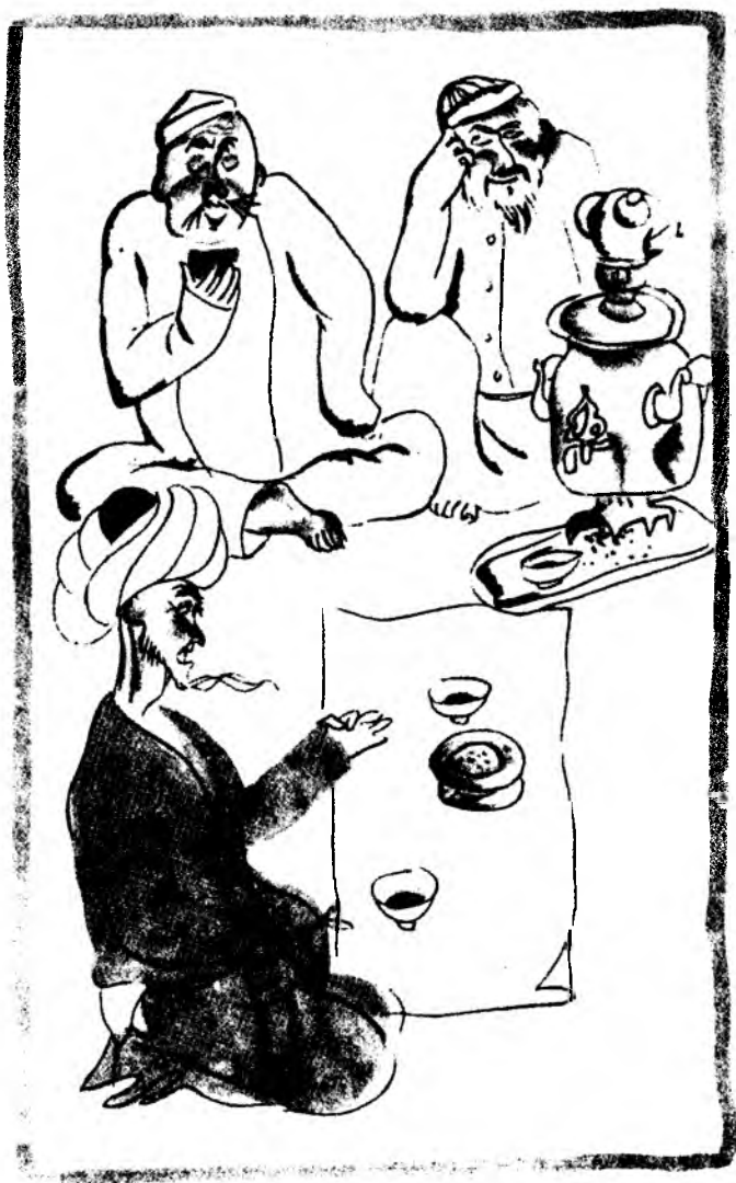
«Совинак қори билан Мағзава қори»