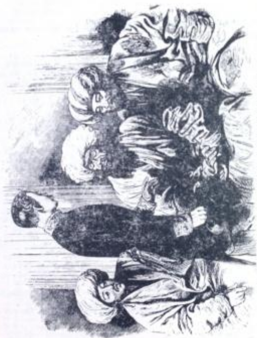
Un gruppo di uomini in Oriente. — Museo Nazionale di Napoli. (No. 8. Epoca, per S. De Dominicis)