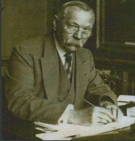
Артур Конан Дойл 1859–1930

Артур Конан Дойл — шотландиялик физик ва ёзувчи.