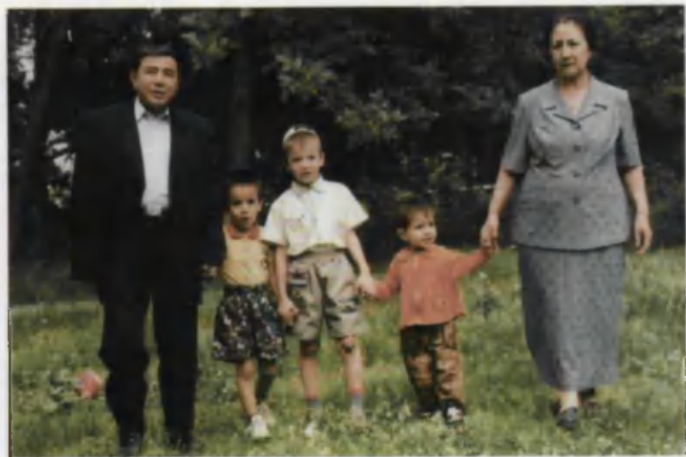
«Уч оғайни ботирлар».