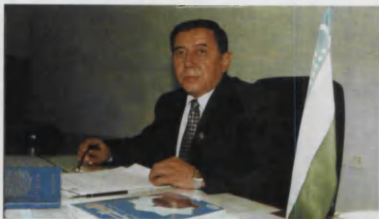
Ишхона ҳам — ижодхона.