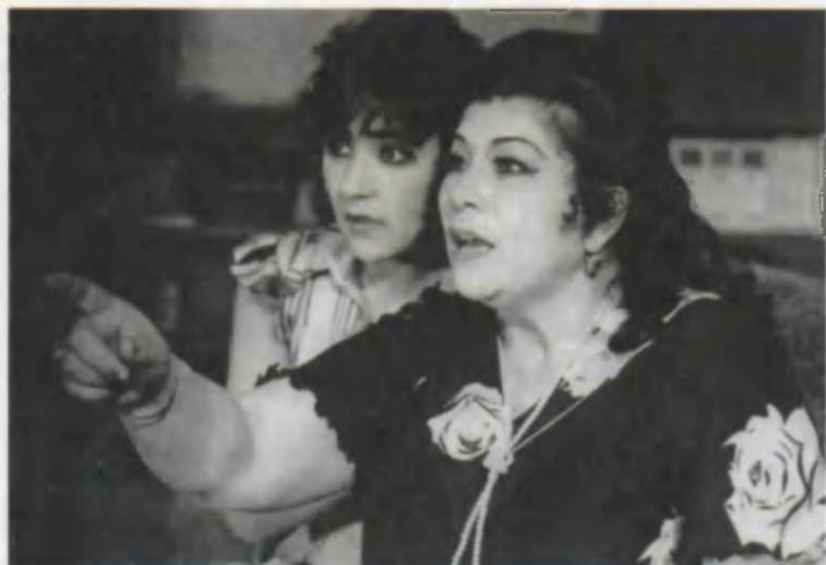
«Тўйлар муборак» комедиясидан кўриниш.