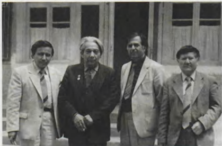
Устоз ва шогирдлар.