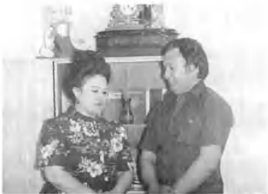
Ёзувчи Олия билан