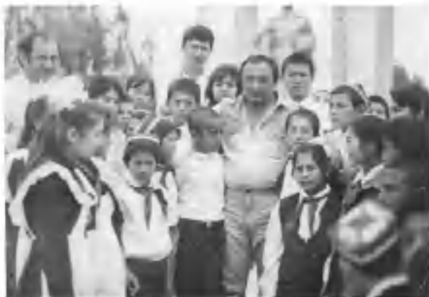
Ёзувчи ўзи ўқиган мактаб болалари билан