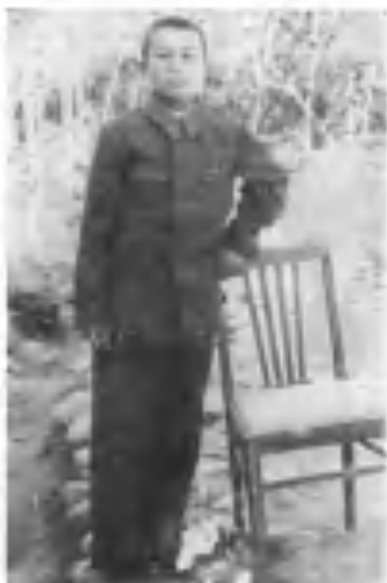
Ёзувчининг 13 ёшлиги