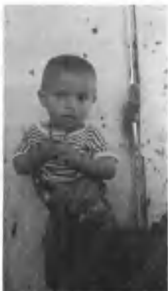
Ёзувчининг ўғли Кабба