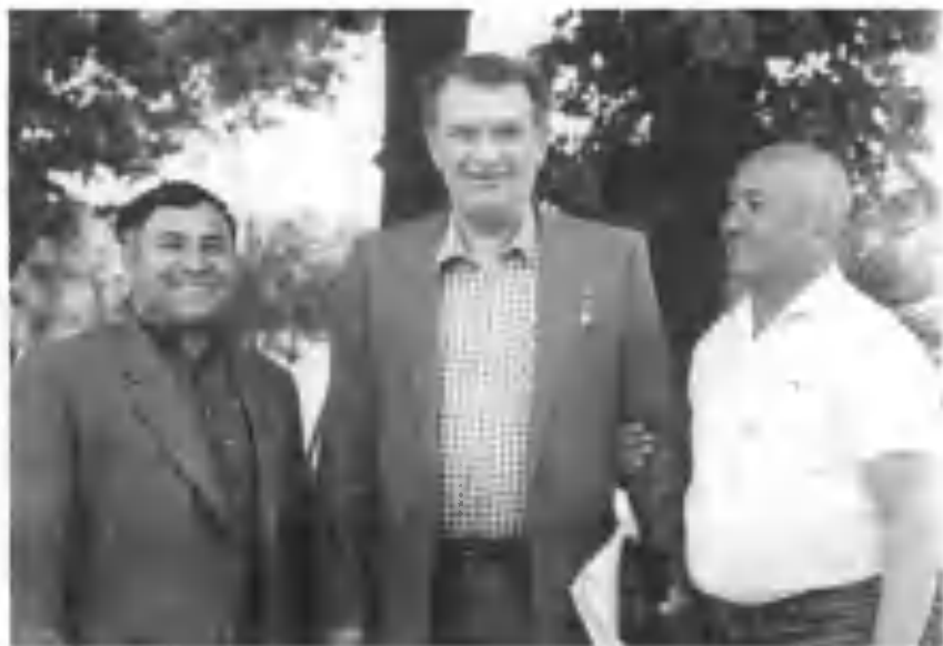
Ёзувчи академик Бунёдов билан