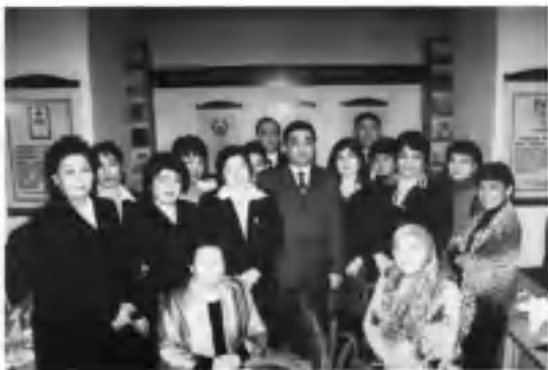
Ўзбекистон Республикаси Хотин-қизлар қўмитаси иштирокидаги илмий-амалий семинардан бир лавҳа.