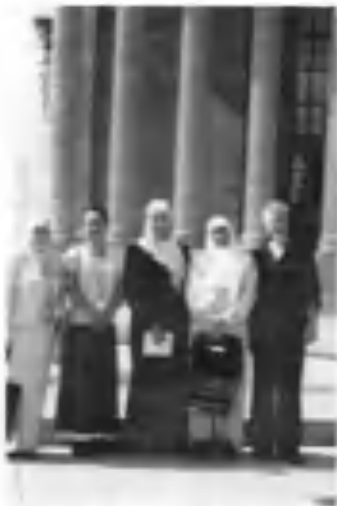
АҚШ сафаридан лавҳа. 2004 й.