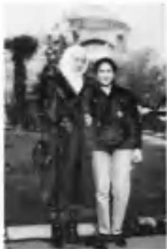
Мунирахон қизимнинг Истамбулда талабалик йилларидан эсдалик. 1993 й.