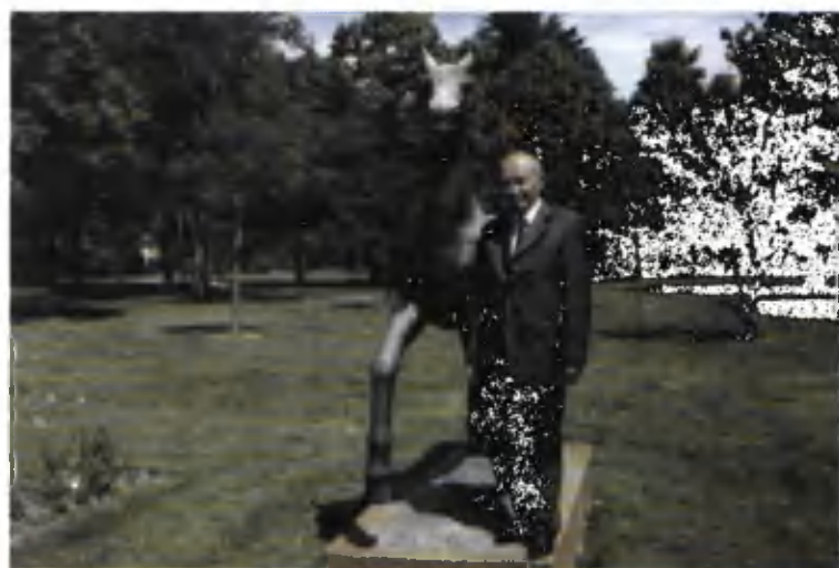
Тойчоқ ҳайкали олдида. Женева, 2007 йил.