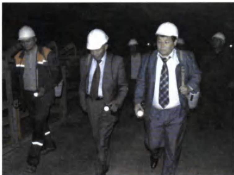
Деҳқонобод калийли ўғитлар заводида. 2010 йил 2 май.