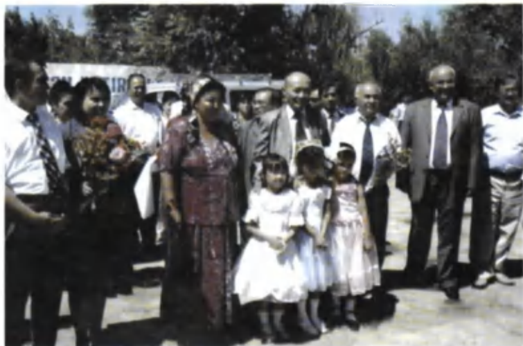
Хоразмлик мухлислар даврасида.