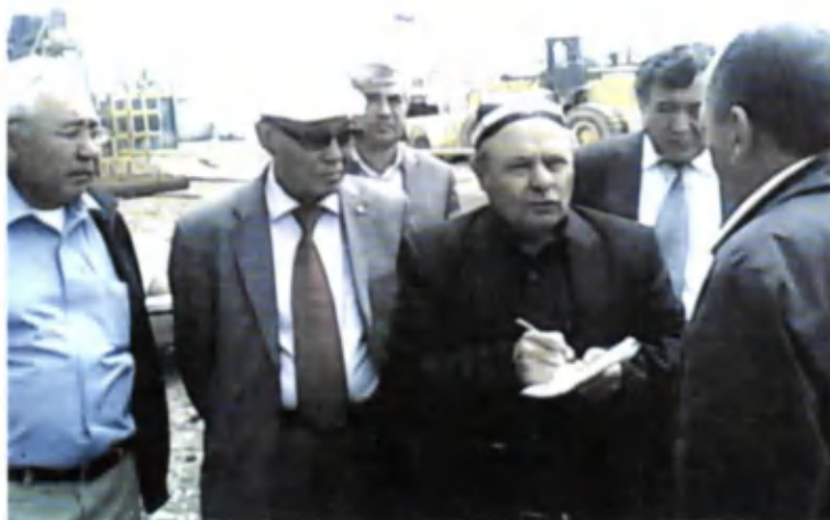
Деҳқонобод калийли ўғитлар заводи билан танишиш.