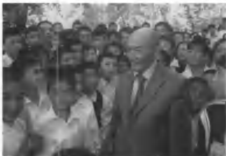
Ёш китобхонлар билан учрашув.