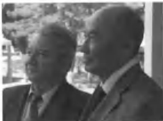
Ўзбекистон халқ шоири Жуманиёз Жабборов билан.