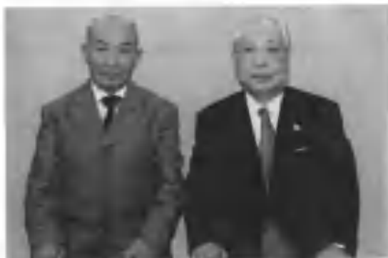
Япон шоири ва файласуфи Дайсаку Икеда билан. 2007 й.