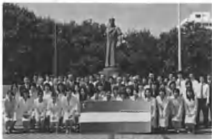
Токио. Сока университети. Алишер Навоий ҳайкали олдида.