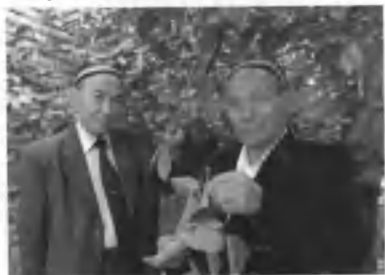
Мели акам билан.