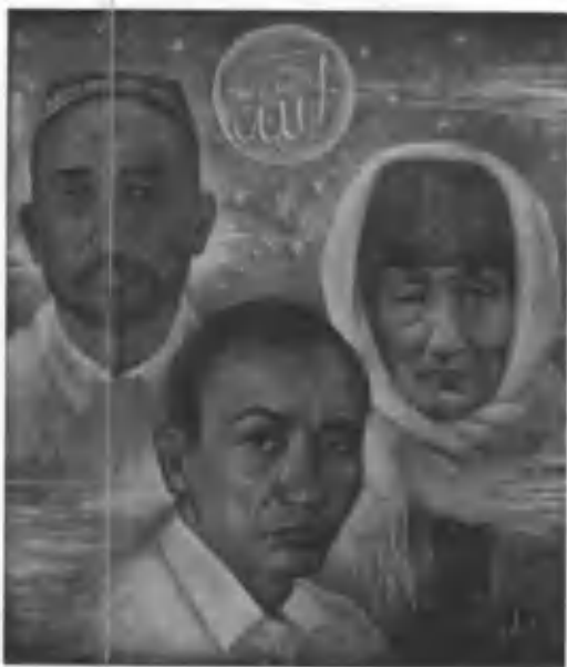
“Муътабар оила”. Мусаввир С. Раҳмонов. 2007 й.