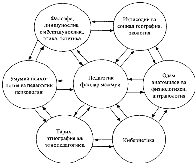
2-расм. Педагогика фанлари мажмуининг бошқа фанлар билан алоқалари

Педагогика тарих, этнография ва этнопедагогика билан ҳам узвий боғлиқ. Сўзсиз, педагогиканинг “Ватан тарихи”, “Адабиёт”, “Со-