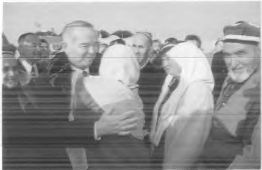
И.А. Каримов халқнинг юксак ишончи ва меҳр-муҳаббатини қозонган