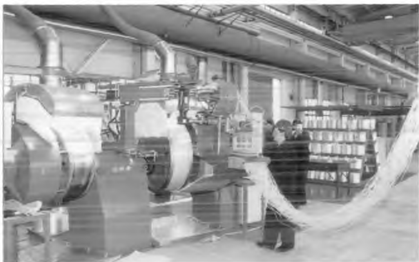
В. Чкалов номидаги Тошкент авиация ишлаб чиқариш бирлашмаси цехида