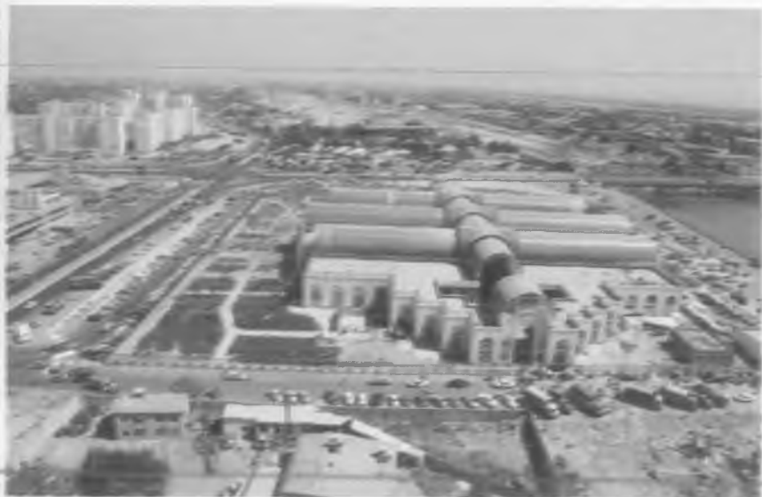
Тошкент. Кўйлик бозори