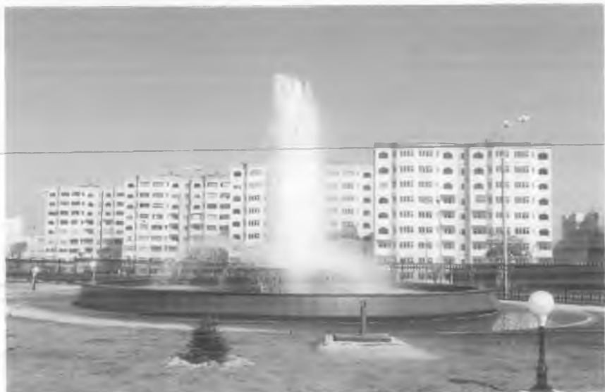
Тошкентдаги янги уй-жойлар