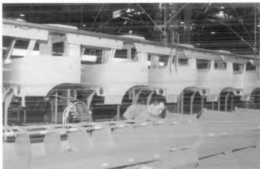
“СамКочавто” заводининг йиғув цехи