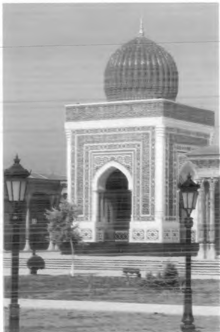
Имом ал-Бухорий мақбараси