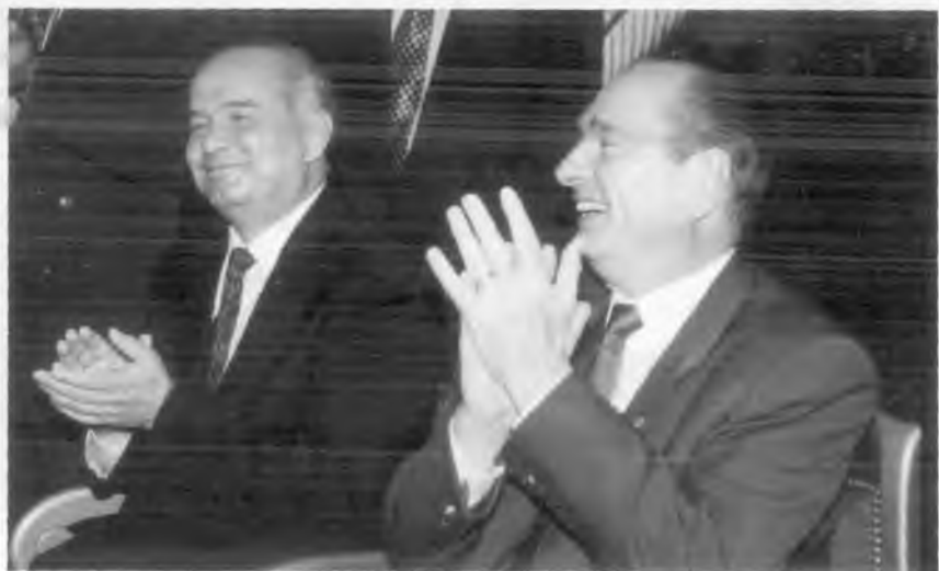
Ўзбекистон Президенти И.А. Каримов ва Франция Президенти Ж. Ширак