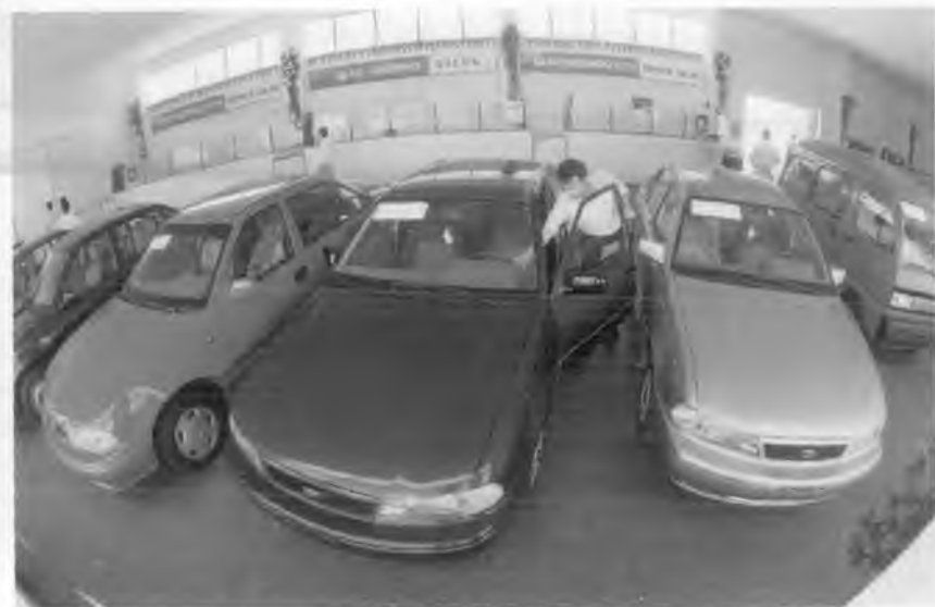
“ЎздЭУавто” заводининг автомобиллари