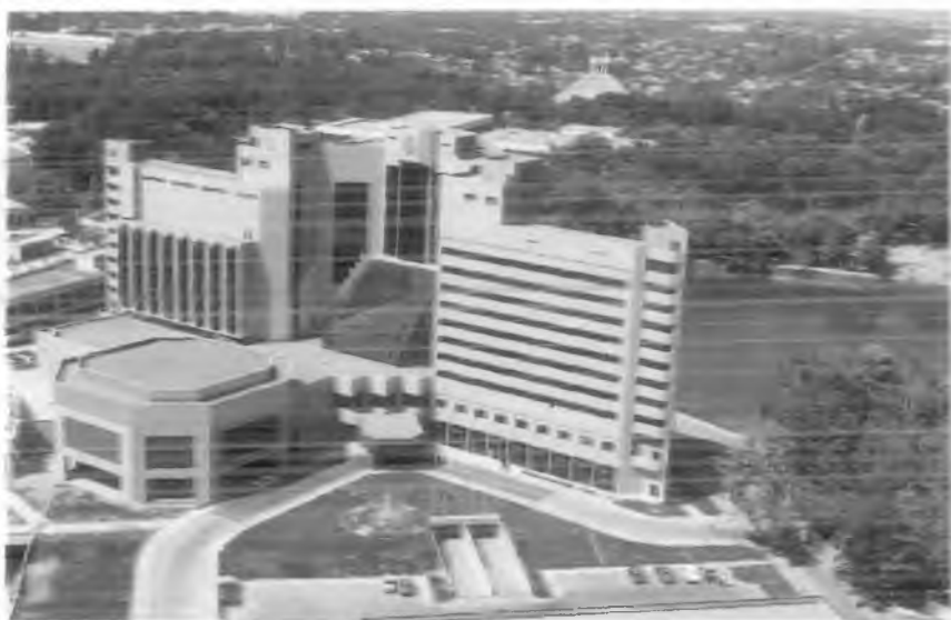
Тошкент. "Интерконтиненталь" меҳмонхонаси