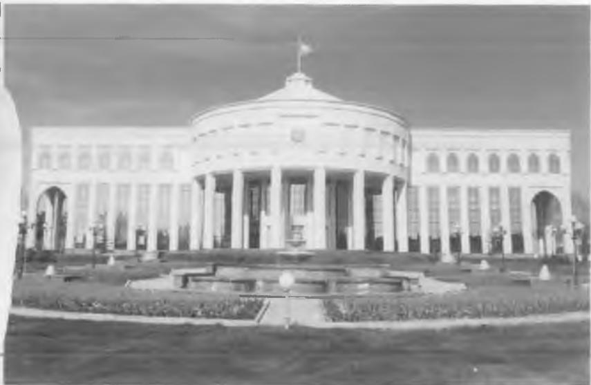
Тошкент. Ўзбекистон Республикаси Президентининг Оқсарой қароргоҳи