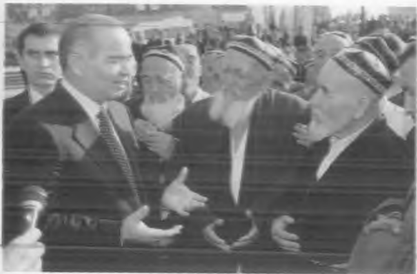
Қариялар билан маслаҳатлашиш — Ўзбекистонга хос яхши анъанадир