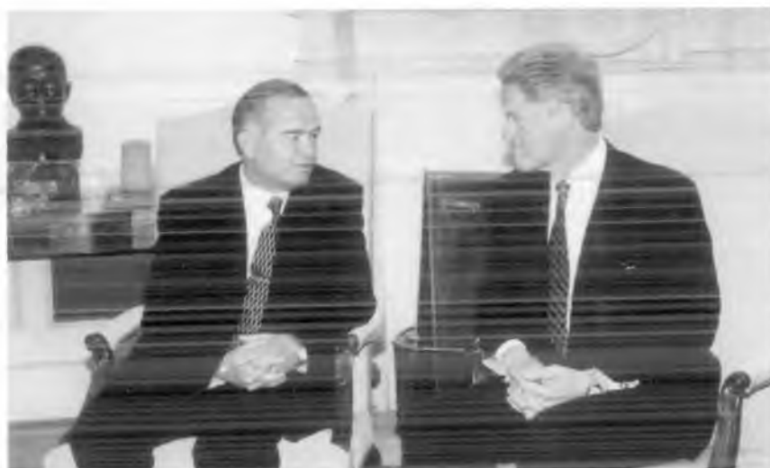
Ўзбекистон Президенти И.А. Каримов ва АҚШ Президенти Б. Клинтон