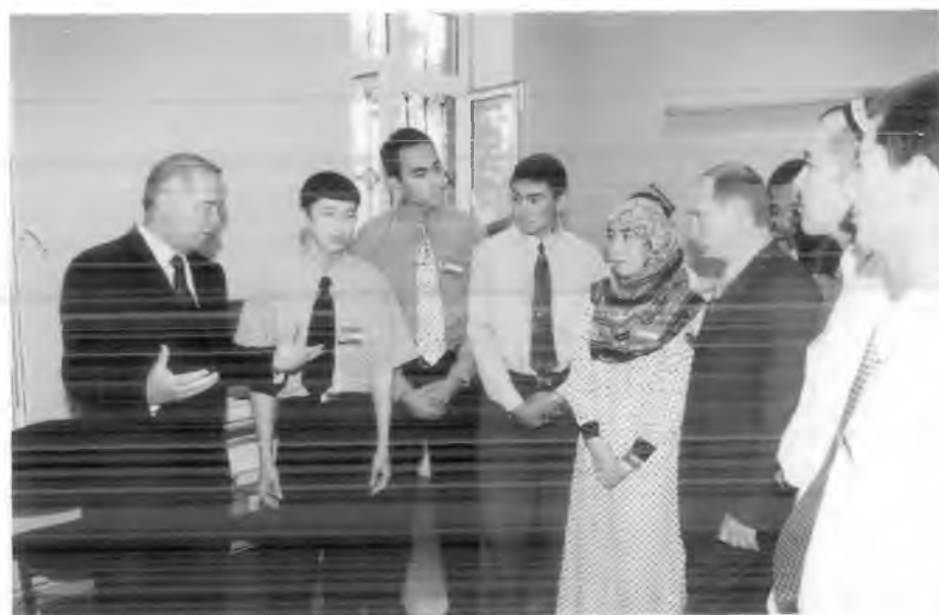
И.А. Каримов ва В.В. Путин ислом университетиди