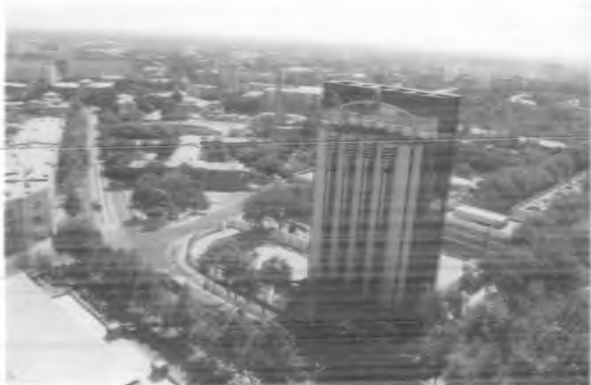
Тошкент. Ўзбекистон Марказий банки