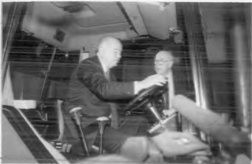
И.А. Каримов комбайн рулида