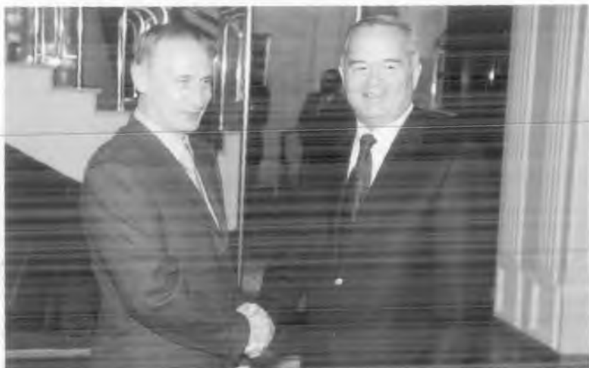
Олий даражадаги учрашувлар: Ўзбекистон Президенти И.А. Каримов ва Россия Президенти В.В. Путин