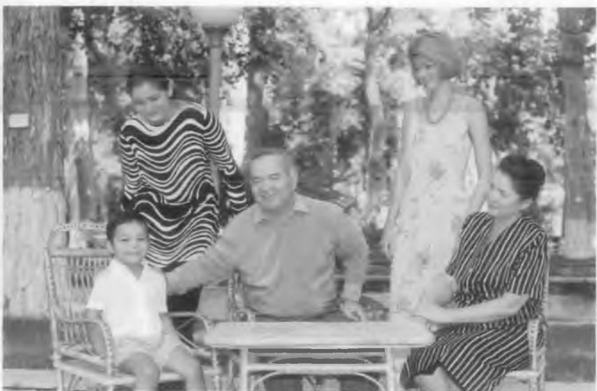
И.А. Каримов оила даврасида