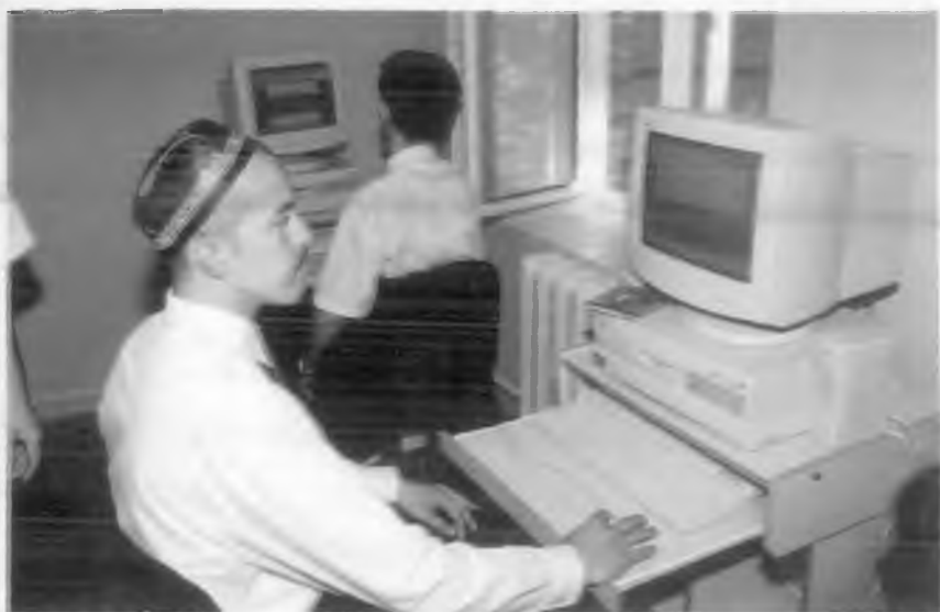
Ислом университетида машгулотлар пайти