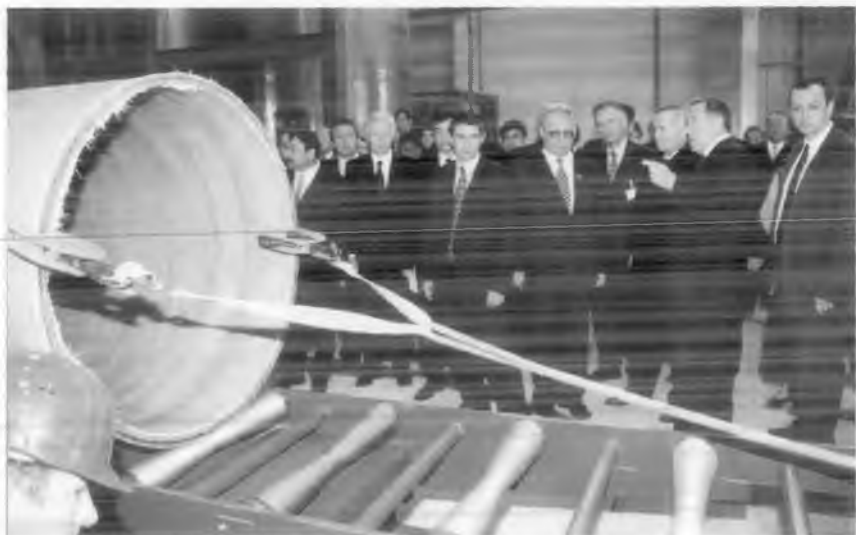
И.А. Каримов "Хобас" қўшма корхонасида