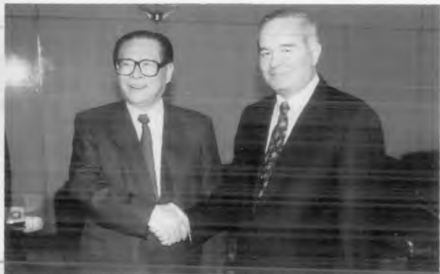
Ўзбекистон Президенти И.А. Каримов ва ХХР Давлат Кенгаши Раиси Цзян Цзэминь