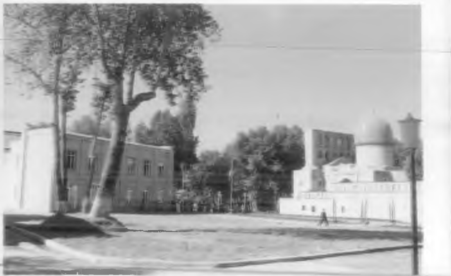
Тошкент ислом университети