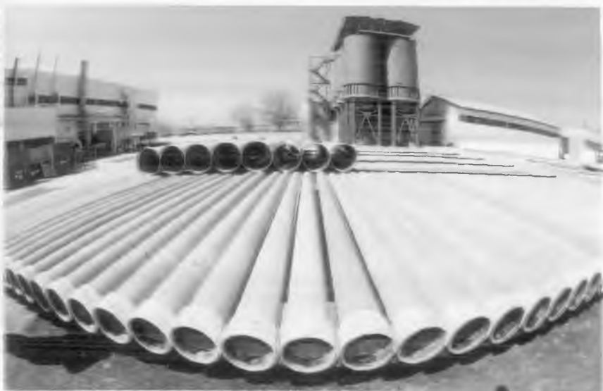
“Хобас” қўшма корхонаси маҳсулотлари