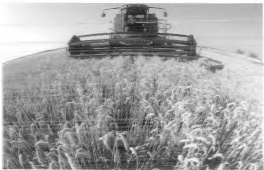
"Ўзкейстрактор" ўзбек-америка қўшма корхонаси комбайни