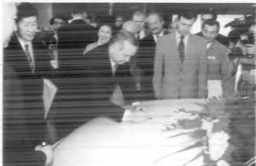
"Оқ йўл, биринчи ўзбек автомобили!"