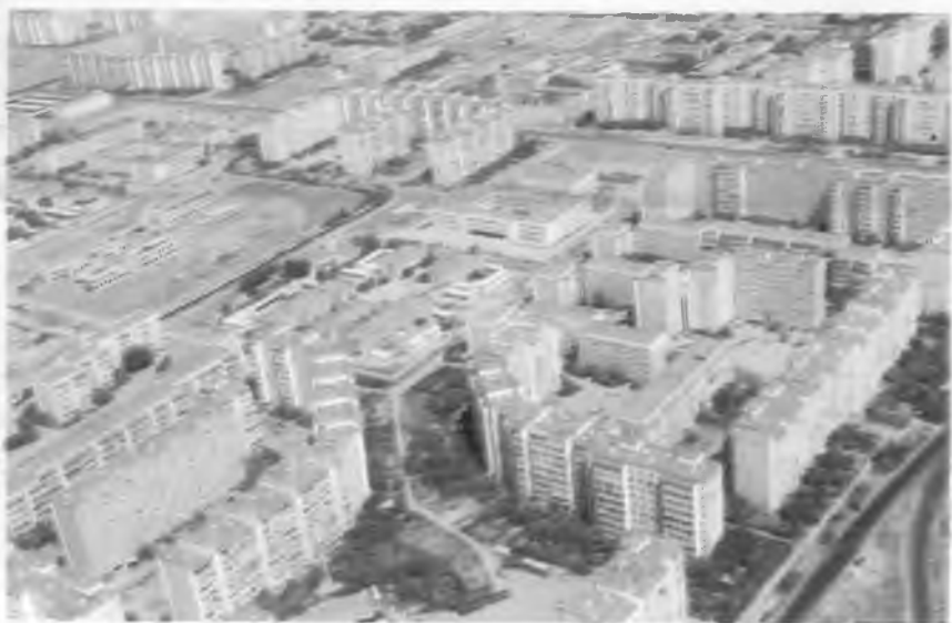
Ўзбекистон пойтахтидаги янги иморатлар