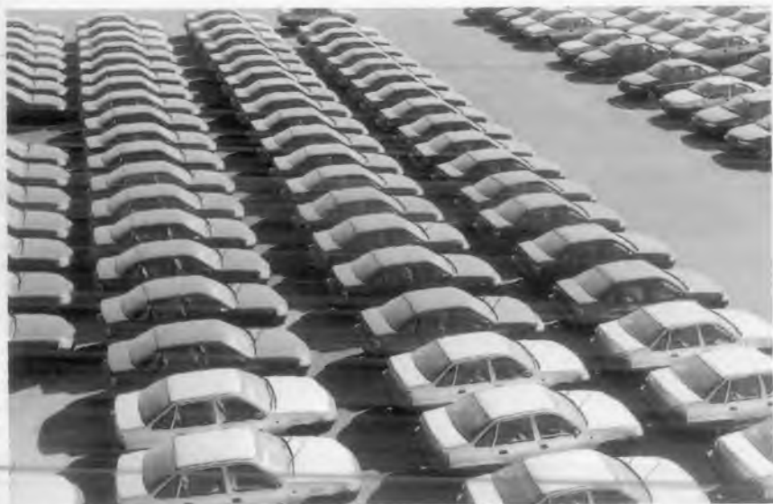
“ЎздЭУавто” автомобиль заводининг тайёр маҳсулотлари