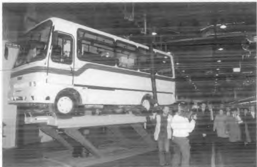
“СамКочавто” автомобиль заводи конвейеридан чиққан илк автобус