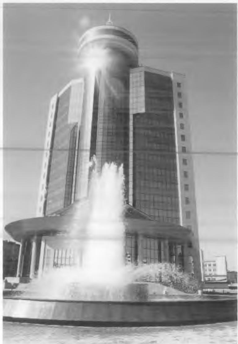
Тошкент. Ўзбекистон банклари ассоциациясининг банклараро молиявий хизматлар маркази