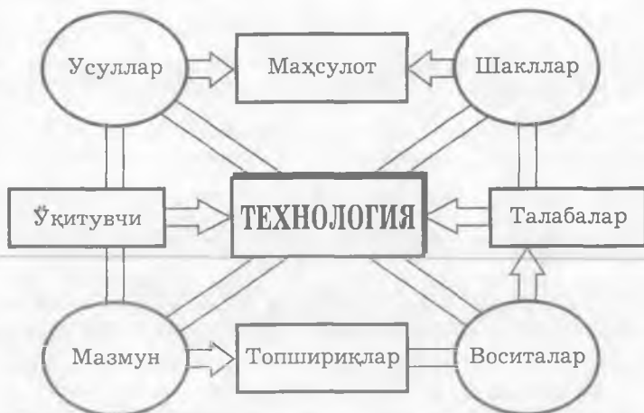
1-расм. Ўқитиш технологияси тузилмаси

Ўқитиш технологияси (жараён сифатида) - педагогик муолажалар, амал ва усуллар кетма-кетлиги (қатъий тартиб шарт эмас) бўлиб, яхлит дидактик тизимни ташкил этади, у педагогик амалиётга жорий этилиши билан кафолатли ўқув мақсадига эришилади ва талаба шахсининг тўлиқ ривожланишига имкон яратади. Технологияни ташкил этадиган муолажалар, амал ва усулларни муайян педагогик натижага эришиш йўлини батафсил ёритадиган алгоритм сифатида талқин қилиш ярамайди. Уларга яхлит тарзда таълим субъектларининг берилган мақсадларга ҳаракатланишини таъминловчи таянч дидактик воситалар сифатида қараш мақсадга мувофиқдир.