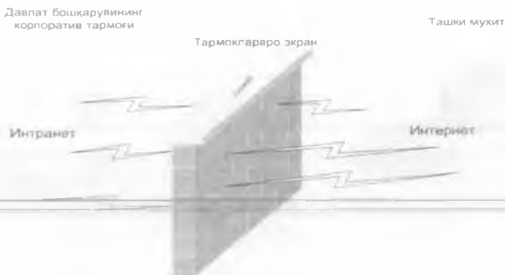
3-расм. Тармоқлараро экранда ахборотни ҳимоя қилиши

Модомики интерактив муҳитлар ахборот хавфсизлиги нуқтаи назаридан ночор бўлиб қолар экан, ахборот алоқаларининг глобаллашуви, бир томондан, ҳуқуққа зид хатти-ҳаракатларнинг янги шакллари ва усуллари, иккинчи томондан – маълумотларнинг етарлича хавфсизлигини таъминлашнинг янги усуллари келтириб чиқаради. Бошқача сўзлар билан айтганда, барча бугинларда – ахборотни сақлаш, уни қайта ишлаш ва кириш муҳофазаланган алоқа каналлари орқали узатишда, очиқ расмий ахборот ресурсларини шакллантиришда, шунингдек ахборот инфратузилмасининг алоҳида муҳим сегментларида ахборот ресурсларининг хавфсизлиги, уларнинг яхлитлиги, уларга кириш мумкинлиги ва уларнинг махфийлиги ҳамда электрон ҳужжатлар муаллифларини бир хилда аниқлаш мумкинлиги ишончли таъминланиши зарурдир.