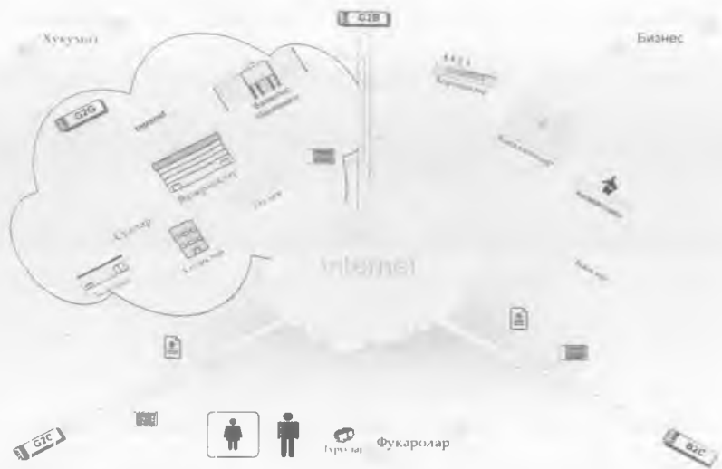
1-расм. Давлат бошқарувида АКТнинг ниматликлари

- фуқароларнинг манфаатларини қандай қилиб энг юқори даражада ҳисобга олиши ва тегишли давлат муассасаларида уларга хизмат курсатиши сифатини қандай қилиб ошириши мумкин (G2C);