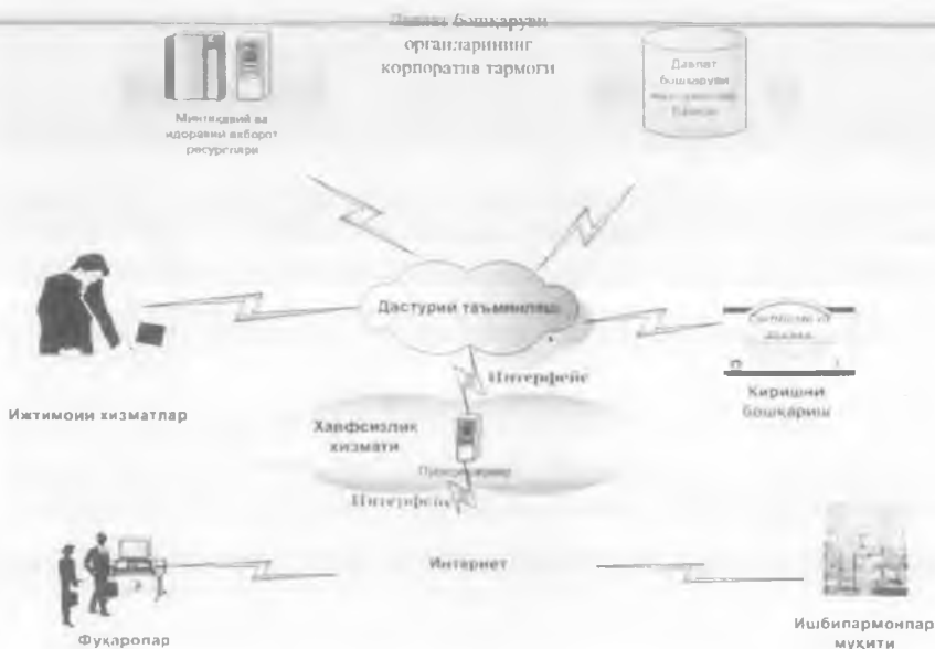
2-расм. Давлат бошқаруви органларининг корпоратив тармоғи

Мазкур схемада келтирилганлардан кўриниб турибдики, ушбу корпоратив тармоқ узида ҳукумат тармоғи ичида давлат муассасалари ўртасида ахборот айирбошланишини ҳам, давлатнинг фуқаролар, бизнес сектори ва Интернетнинг глобал ресурслари орқали бошқа ташқи фойдаланувчилар билан алоқаларини ҳам таъминлайдиган комплекс техник, технологик ва ташкилий воситаларни ифодалайди.