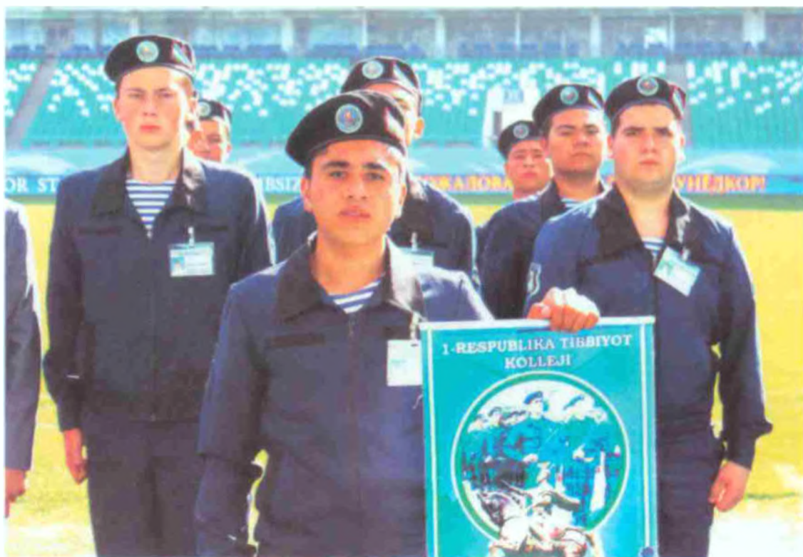
Чилонзор туманидаги 1-Республика тиббиёт коллежи жамоаси