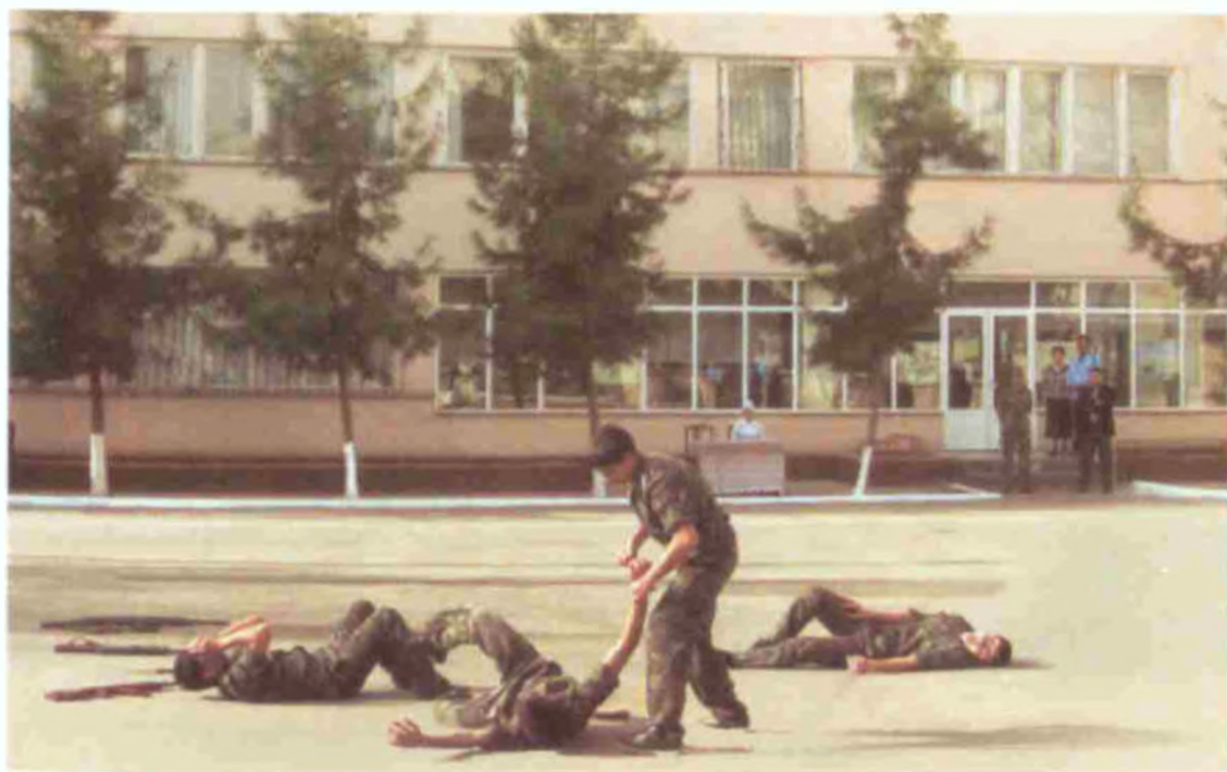
Мардлар майдонда синалади