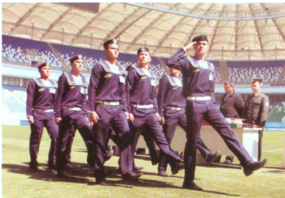
Ўзбекистон Миллий университети қошидаги С.Ҳ.Сирожиддинов номидаги академик лицей жамоаси