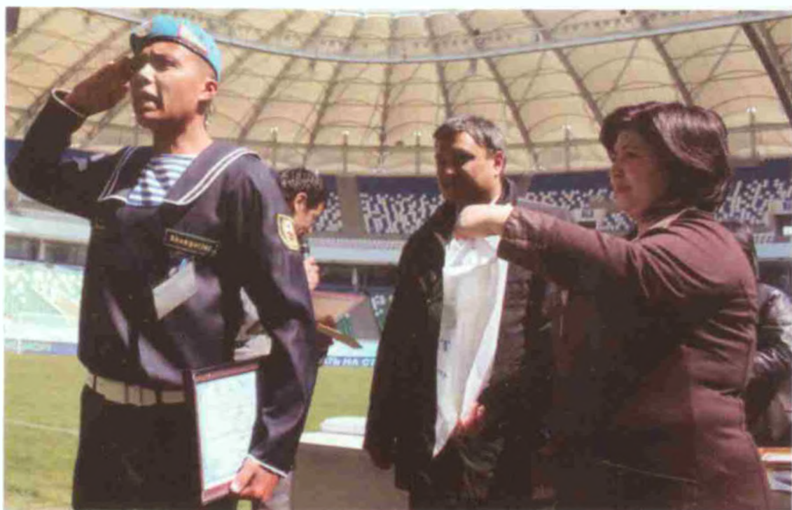
«Ватанимга хизмат қиламан»