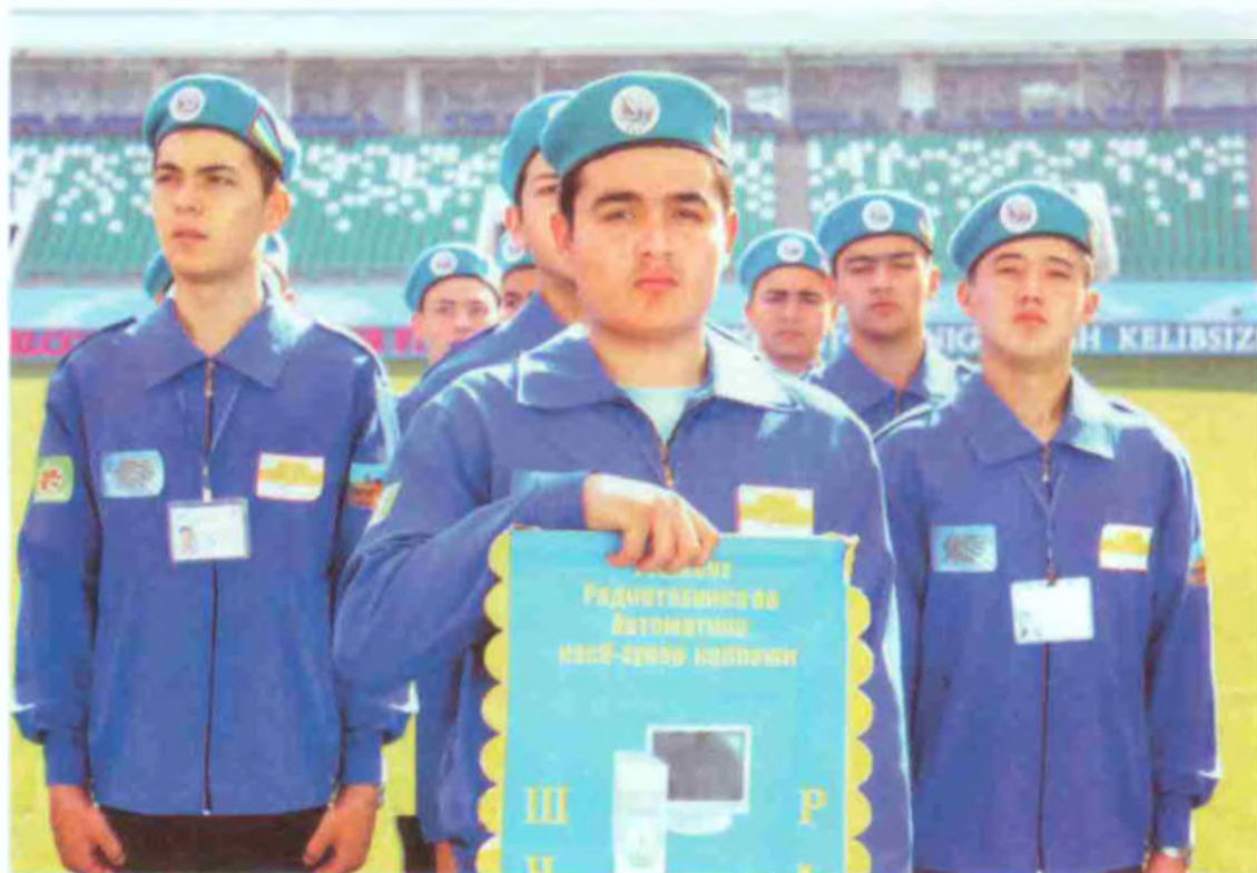
Чилонзор туманидаги Тошкент радио-техника касб-хунар коллежи жамоаси