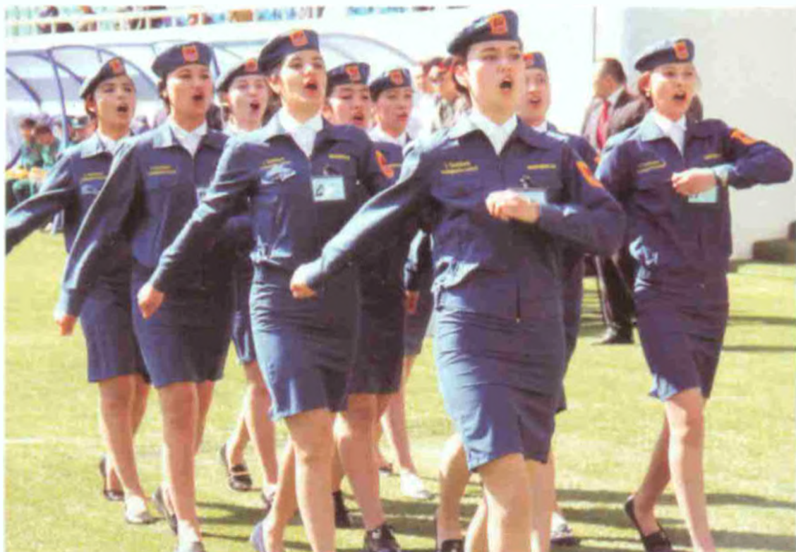
Чилонзор педагогика коллежи жамоаси