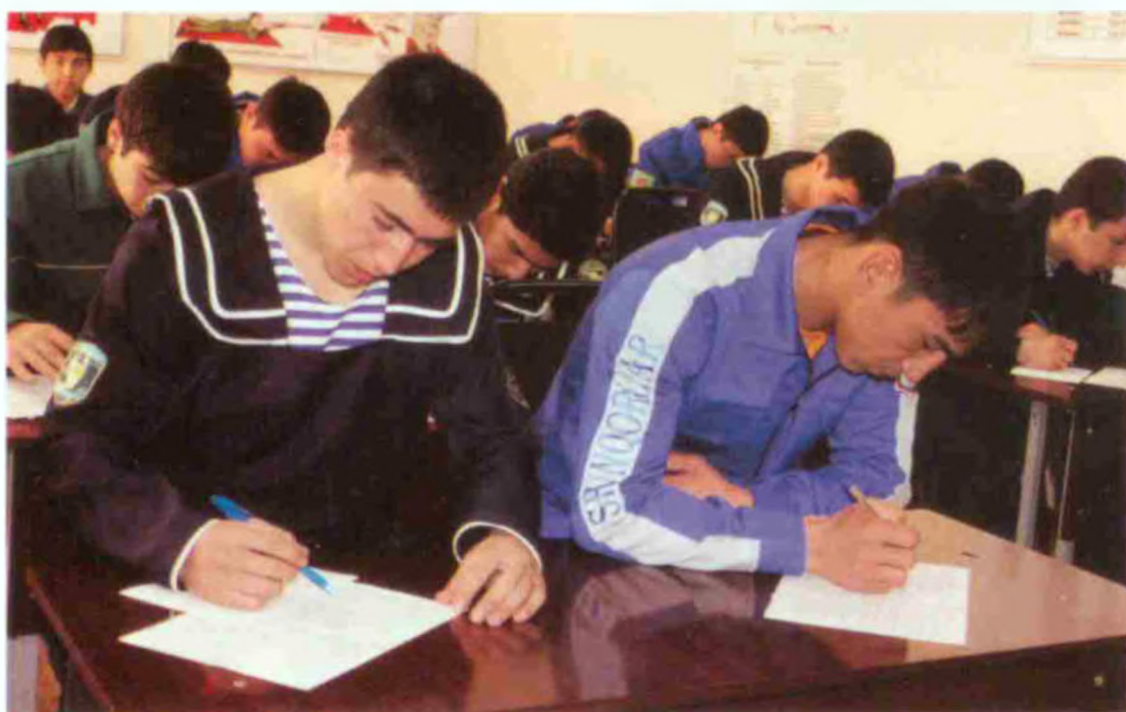
«Ўзбекистон мустақилликка эришиш оstonасида» китоби юзасидан тайёрланган тест саволларини ечиш жараёни