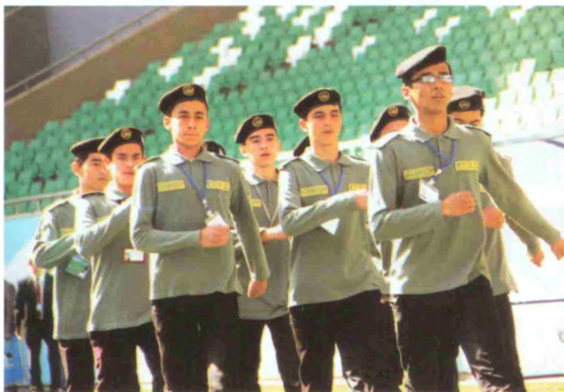
Тошкент транспорт касб-хунар коллежи жамоаси