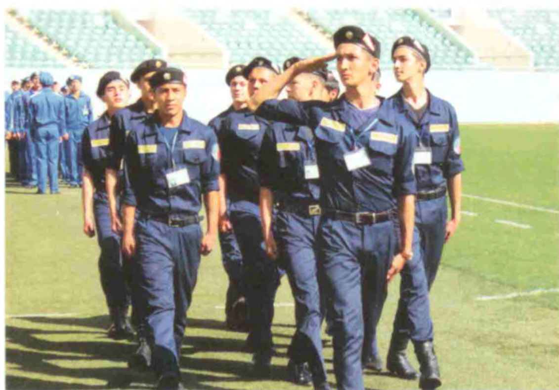
Чилонзор матбаа касб-ҳунар коллежи жамоаси