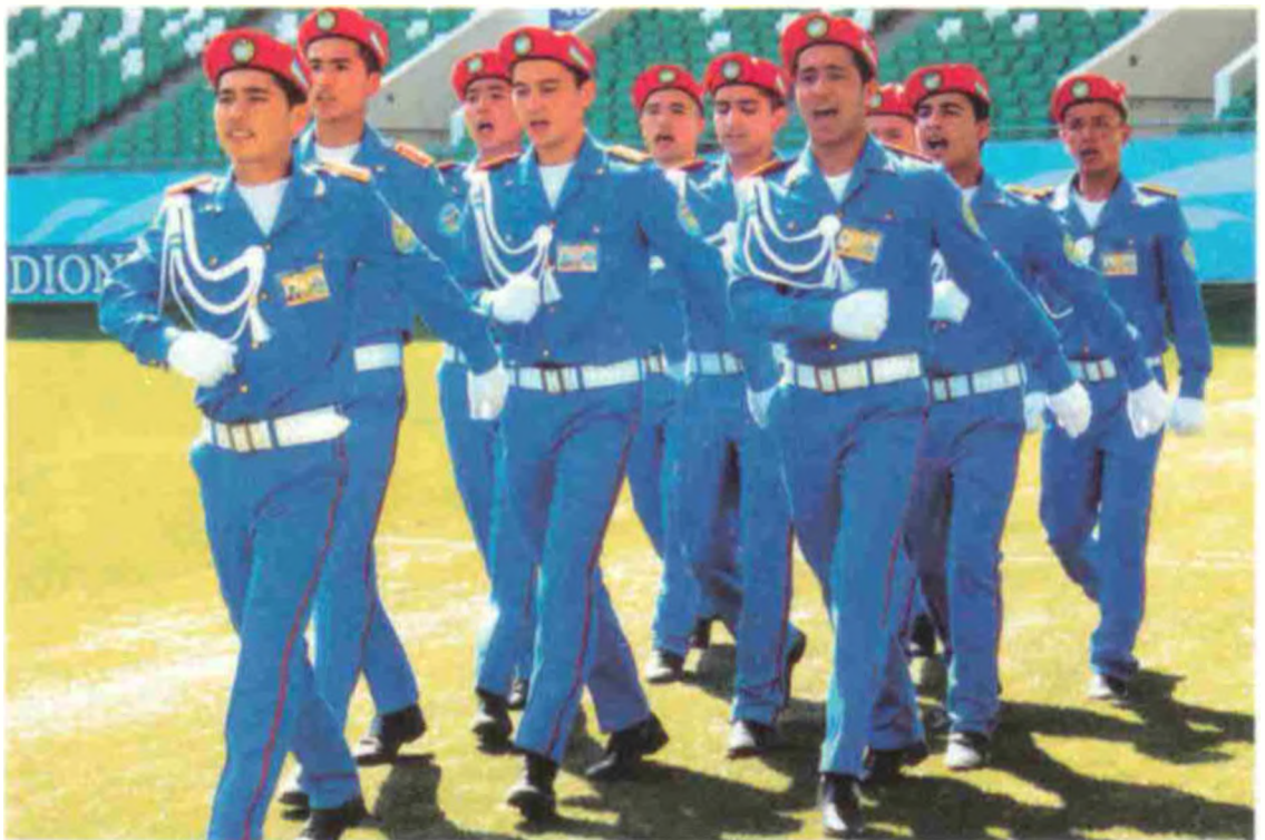
Республика ихтисослаштирилган мусиқа ва санъат академик лицейи жамоаси