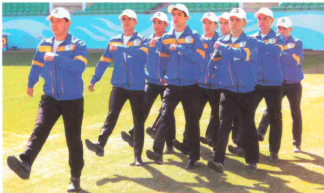
Юнус Ражабий номидаги Тошкент педагогика коллежи жамоаси