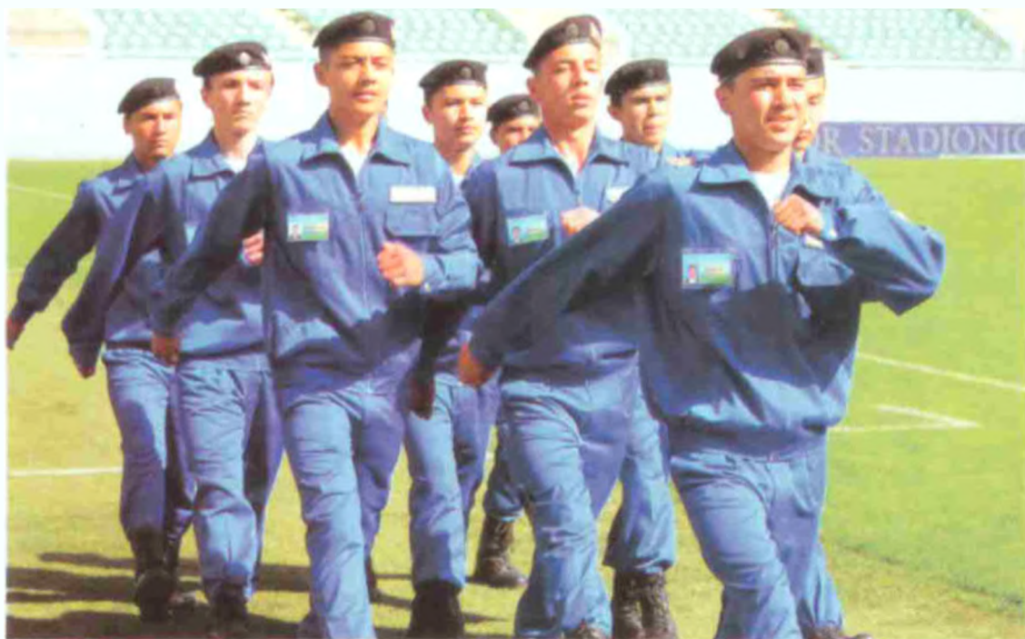
Чилонзор туманидаги Тошкент автомобил йўллари касб-ҳунар коллежи жамоаси