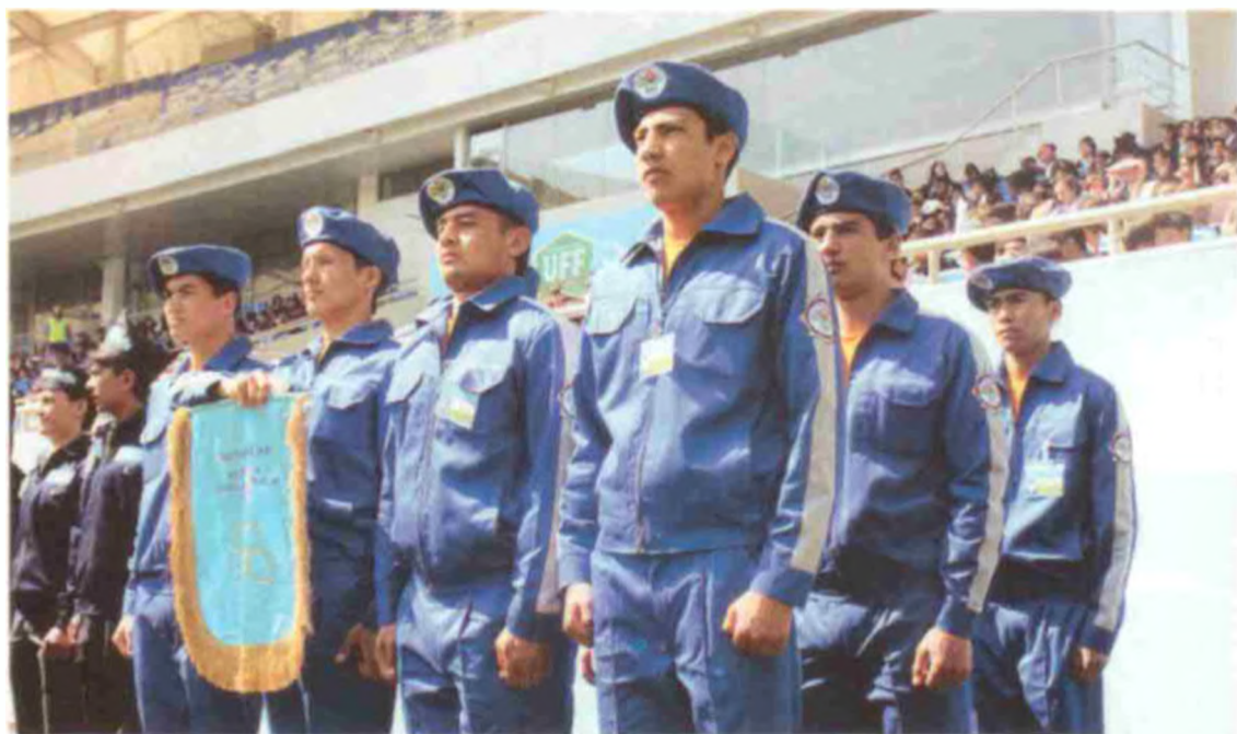
Республика Олимпия захиралари коллежи жамоаси