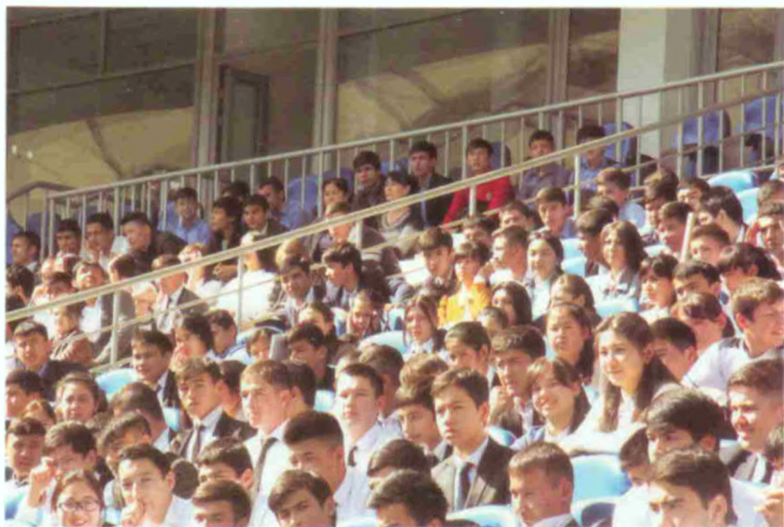
Танлов – ёшлар нигоҳида