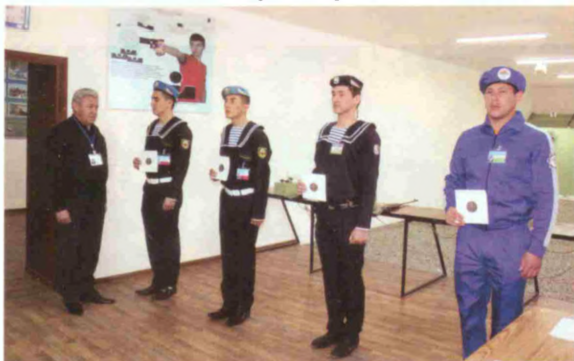
Ўқ нишонга тегди