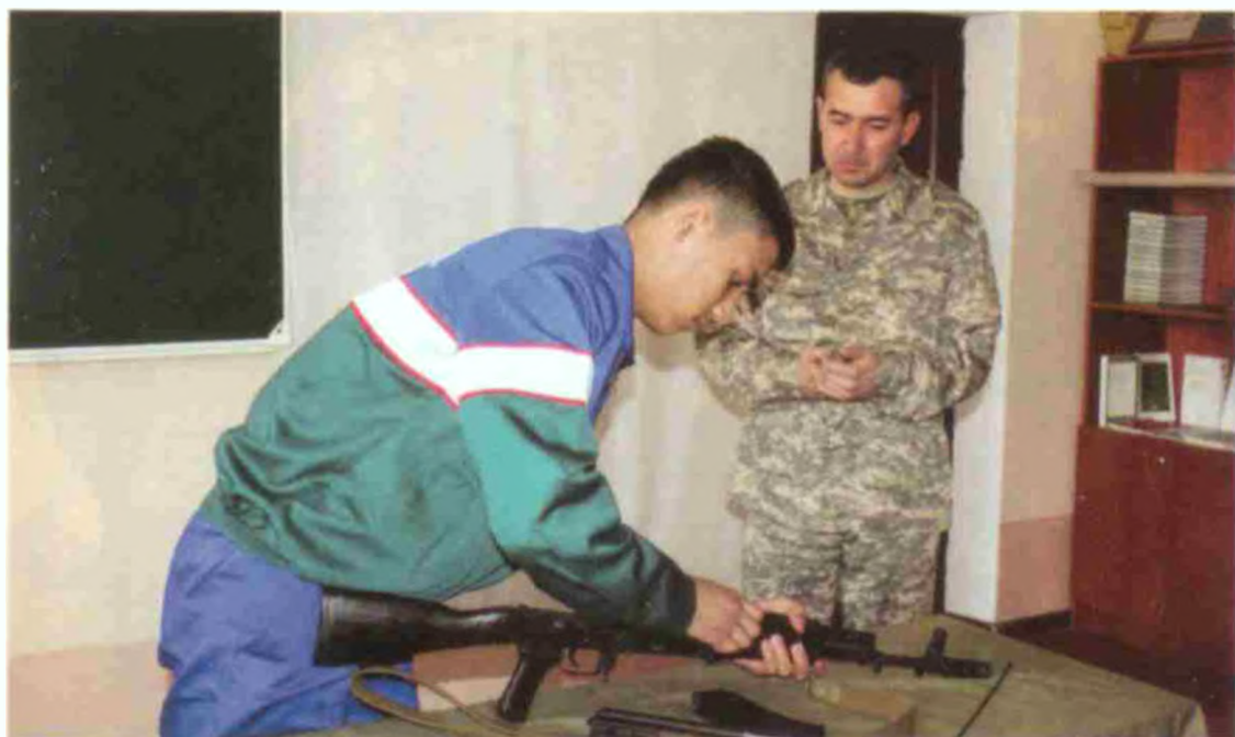
АК–74 қуролни тўлиқ ва нотўлиқ қисмларга ажратиш