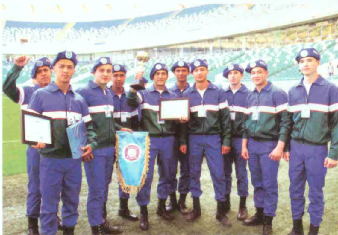
2-Тошкент юридик коллежи жамоаси