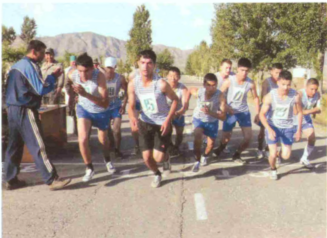
1000 метр масофага югуриш