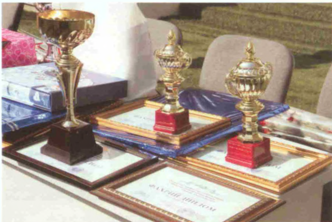
Совринлар – меҳнатнинг самараси