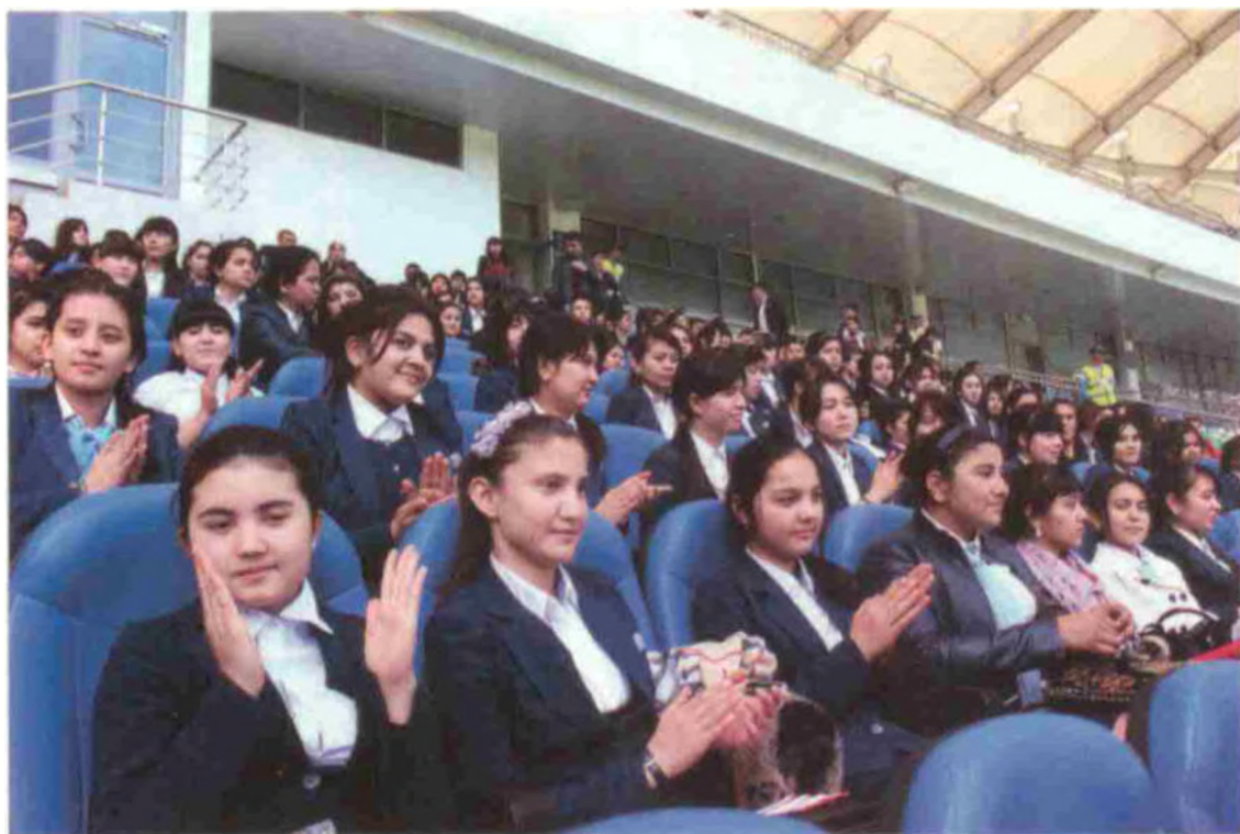
Томошабинлар мусобақа иштирокчиларини олқишлаб турибдилар