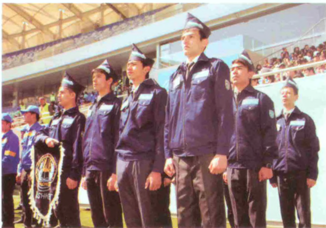
Чилонзор туманидаги коммунал хизмат кўрсатиш касб-ҳунар коллежи жамоаси