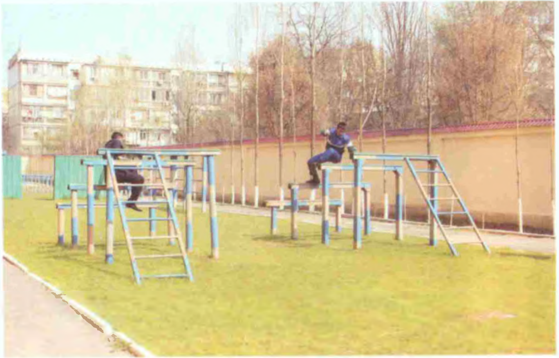
Тўсиқлар йўлагидан ўтиш