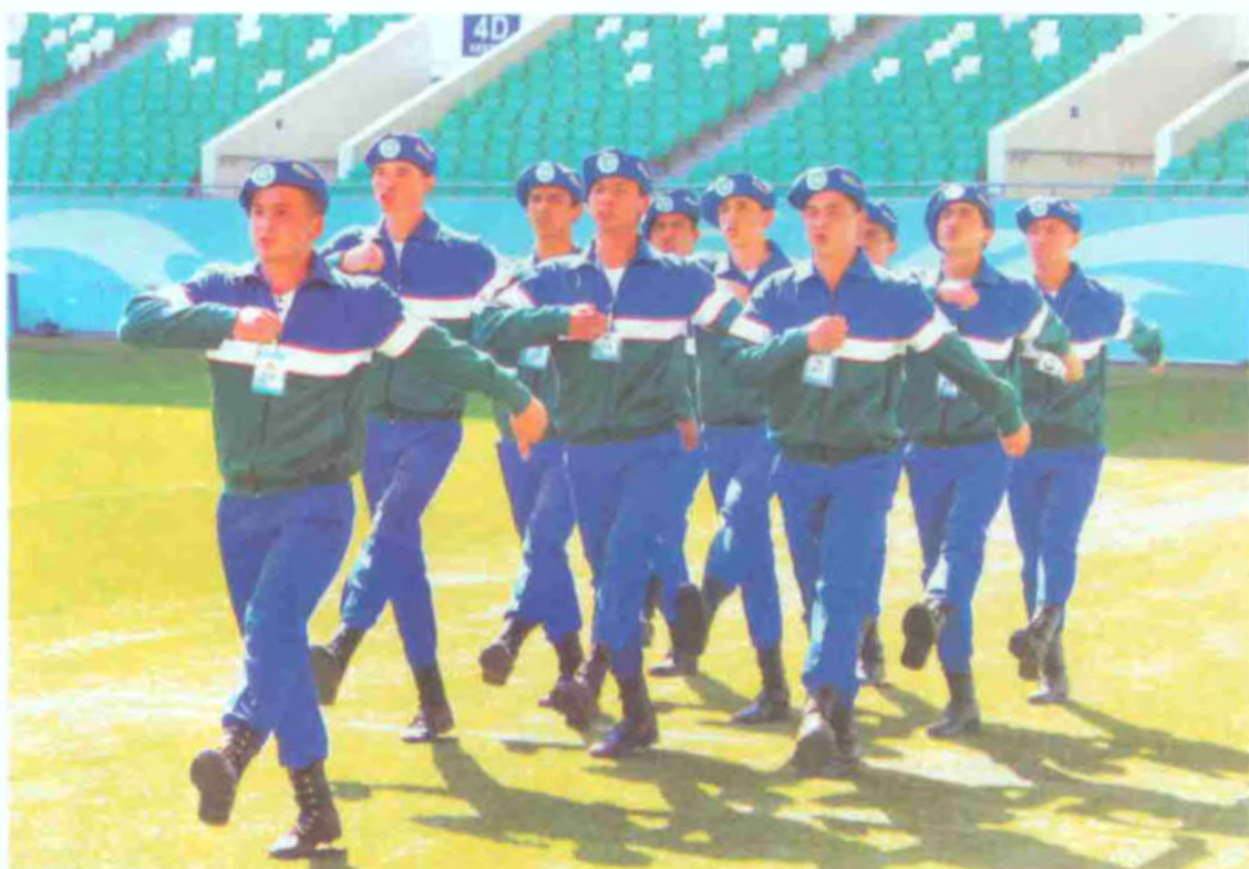
Чилонзор туманидаги 2-Тошкент юрлик коллежи жамоаси