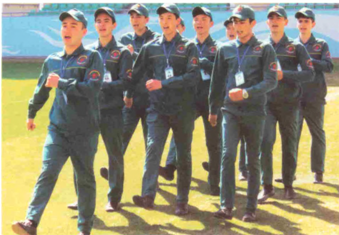
Чилонзор тиббиёт коллежи жамоаси