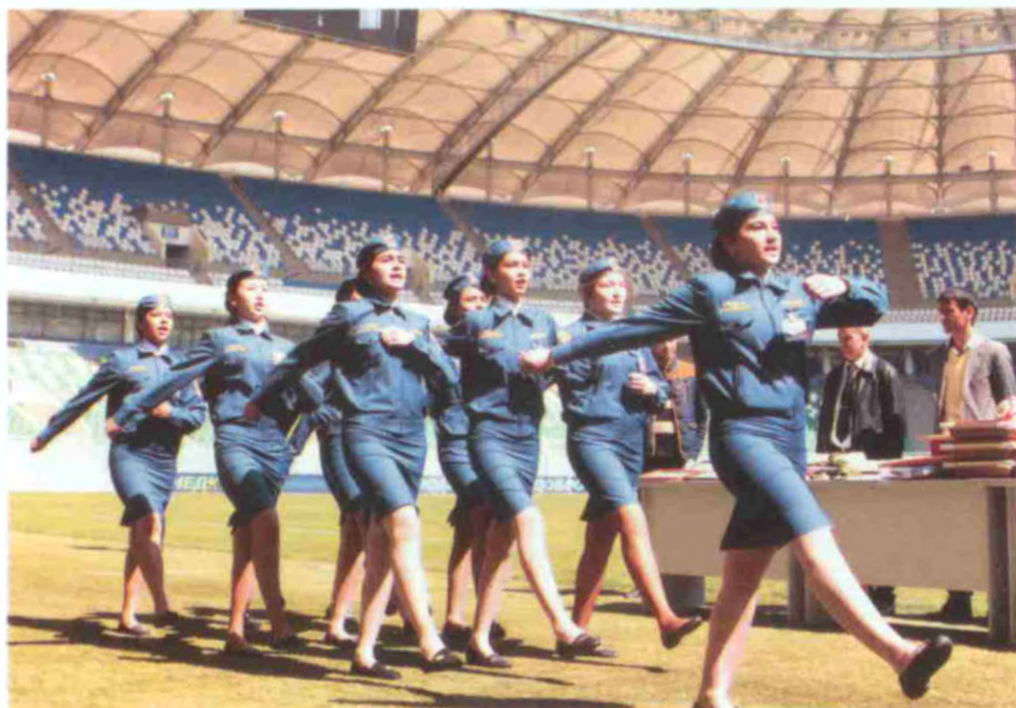
Чилонзор педагогика коллежи жамоаси