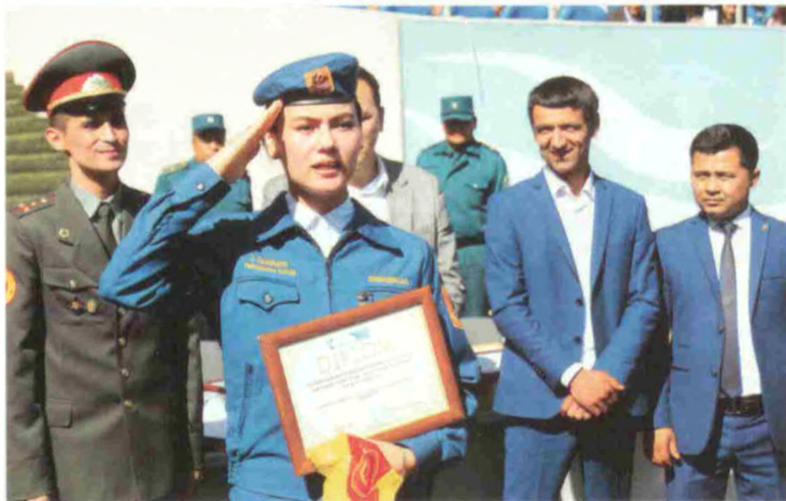
«Ватанимга хизмат қиламан»