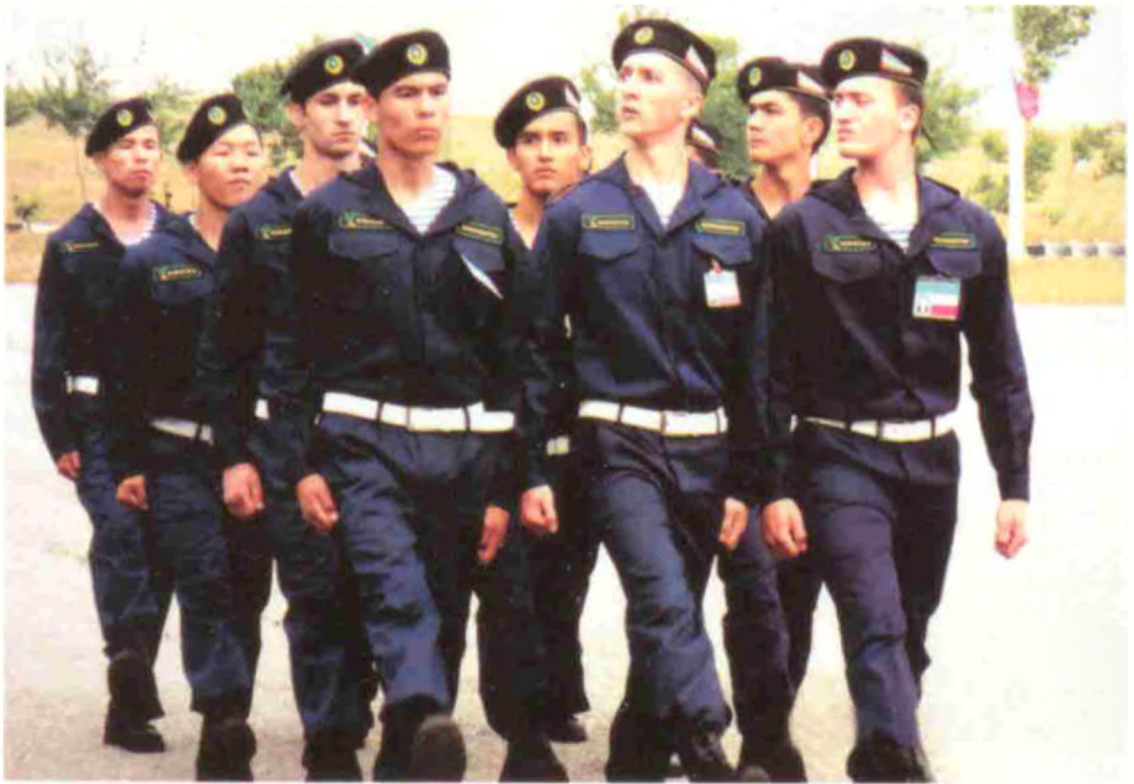
Тошкент Давлат Техника университети қошидаги академик лицей жамоаси