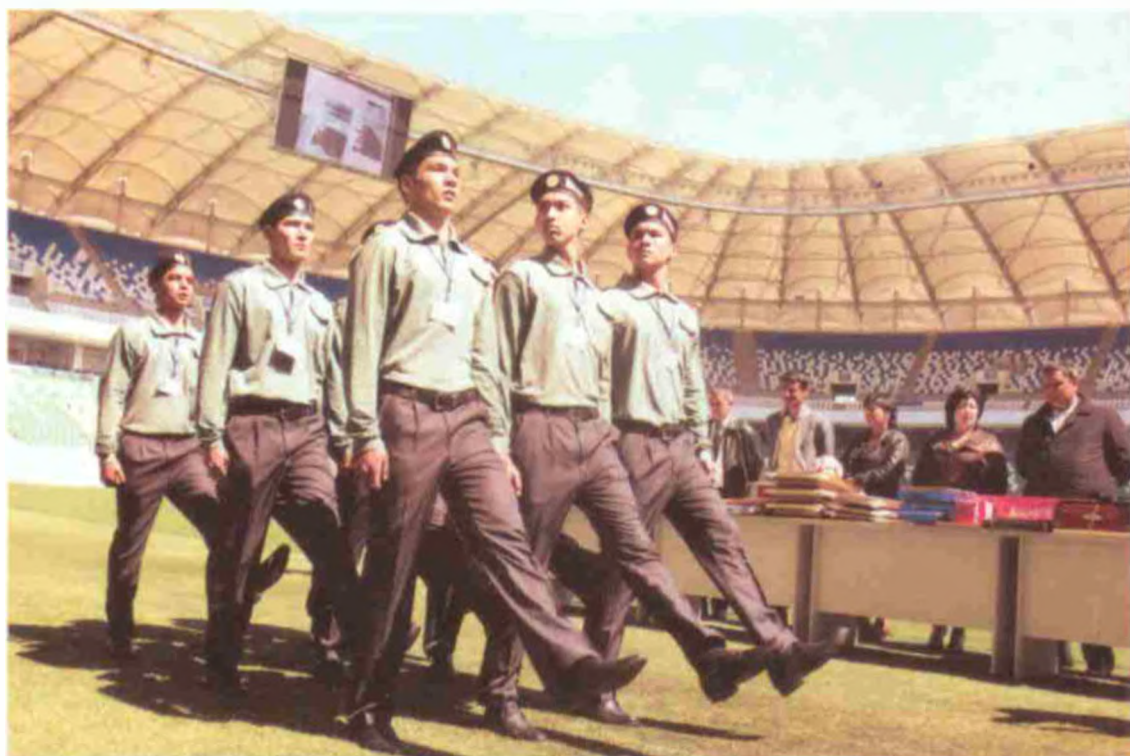
Тошкент давлат Иқтисодиёт университети қошидаги Чилонзор академик лицей жамоаси