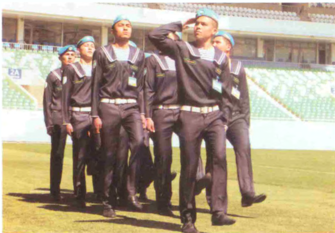
Тошкент банк ҳисоб-кредит коллежи жамоаси