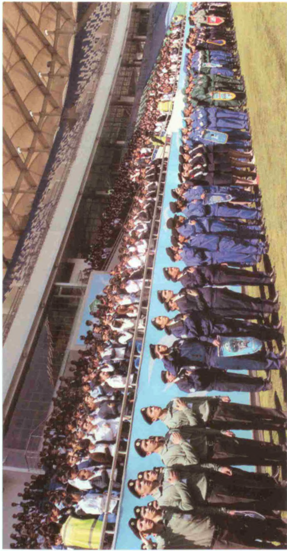
«Бунёдкор» марказий стадиони. «Шунқорлар» ҳарбий-спорт мусобақаларининг тақдирлаш маросими