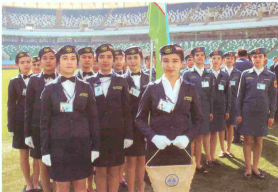
Чилонзор туманидаги Тошкент педагогика коллежи жамоаси