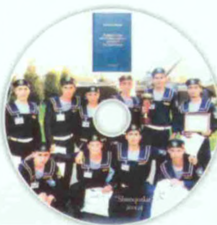
«Шунқорлар» ҳарбий-спорт мусобақаларидан видеолар туширилган дисклар