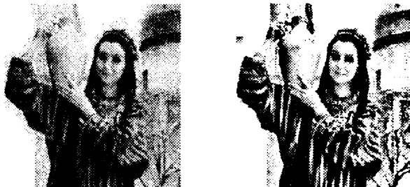
Рис. 1 - Обработанное изображение при нечеткой исходной информации

В целях увеличения эффективности метода предлагается дополнительно оценивать локальные окрестности изображения с учетом среднеквадратических отклонений относительно яркости центрального элемента и на том основании формировать функцию нелинейного преобразования локальных контрастов яркостей элементов изображения.