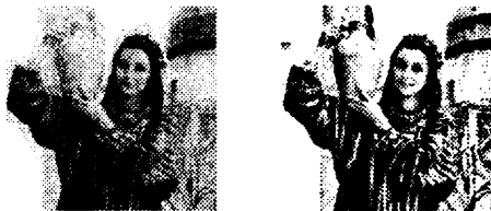
1-rasm. Noravshan dastlabki ma'lumotlarga ega ishlov berilgan tasvir

Tasvirning har bir nuqtasida natijaga erishish uchun ishlov berish protseduralarining aksariyati qayta ishlanayotgan nuqtani o'rab turgan asl tasvirdagi ma'lum nuqtalar to'plamidan ma'lumotlarni kiritishni o'z ichiga oladi. Shu bilan birga, bir qator protseduralar mavjud bo'lib, ularda elementlarga ishlov berish amalga oshiriladi. Xira tasvirda har bir elementni noravshan to'plam sifatida ko'rish mumkin.