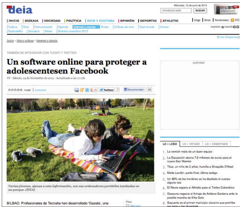
Figura 11.

2. Para conducir el experimento se descartó el uso del correo postal. Se valoró la visibilidad que se puede llegar a obtener con este método, pero se consideraron sus inconvenientes, como la dificultad de llegar a cada receptor de forma directa, rápida y eficiente o la imposibilidad de aportar elementos de valor añadido, como los enlaces, materiales en otros soportes o el texto electrónico, que posteriormente puede ser copiado, adaptado y refundido.