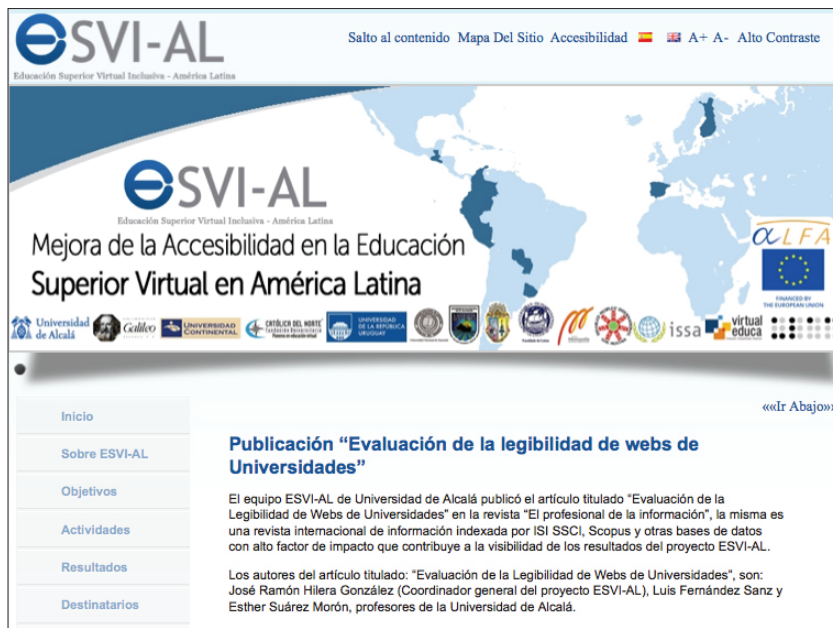
Figura 7. Educación Superior Virtual Inclusiva – América Latina (ESVI-AL)

manifiesta el grado de obsolescencia de un documento de referencia para el sector comunicativo español. En la Agenda de la Comunicación 2012 se detectaron carencias similares, puesto que se incluían empresas que habían cesado su actividad o habían cambiado de denominación.