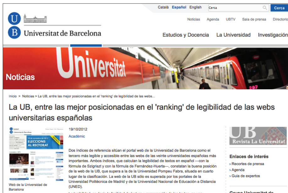
Figura 5. Universitat de Barcelona

El número de impactos en medios de comunicación generalistas fue reducido en comparación con la repercusión en plataformas académicas. Cabe tener en cuenta la sobreabundancia de comunicados recibidos por los periodistas ( Fernández-Asenjo; De-la-Torre-Alfaro , 2009), que provoca que se deseche “el 85% de las