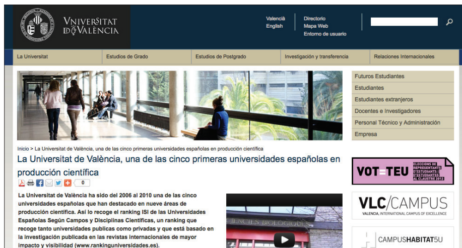
Figura 4. Universitat de València

La redacción de las notas informativas se rigió por los criterios éticos fundamentales de la profesión (Fernández-Asenjo; De-la-Torre-Alfaro, 2009; Risquete, 2006). Según explica el Col·legi de Periodistes de Catalunya, "los gabinetes de comunicación prestan un servicio de información y de comunicación social, de acuerdo con las premisas deontológicas