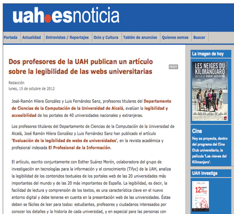
Figura 6. Universidad de Alcalá de Henares

Tampoco se pueden obviar las dificultades técnicas. El envío de la primera nota de prensa subrayó una carencia muy significativa de la Agenda de la Comunicación . Entre las 1.120 direcciones que integraron el primer listado de mailing , se obtuvo una tasa de correos rechazados del 10%. Se observaron como causas principales de estos rechazos los buzones de correo llenos y direcciones desactualizadas. Esta cifra