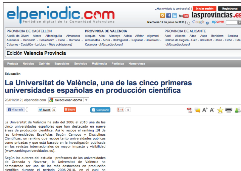
Figura 1. El Periòdic. Periòdic digital de la Comunitat Valenciana