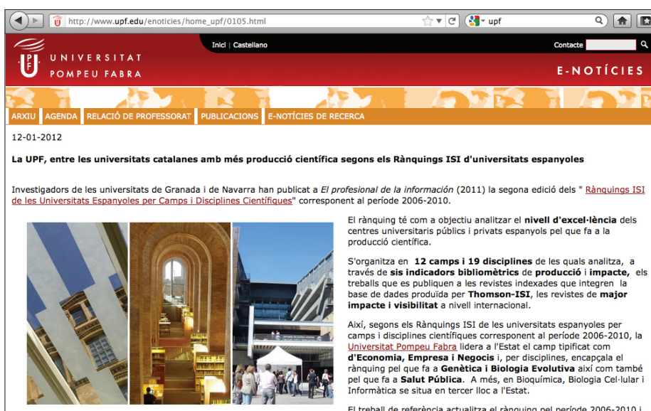
Figura 2. Universitat Pompeu Fabra

Durante el estudio, llevado a cabo entre noviembre de 2011 y noviembre de 2012, se seleccionaron diez artículos, tomando como criterios básicos su calidad, interés, relevancia, carácter noticiable ( Baines; Egan; Jefkins, 2004; De-Se-mir; Ribas; Revuelta, 1998; Pander-Maat; De-Jong, 2012 ) y