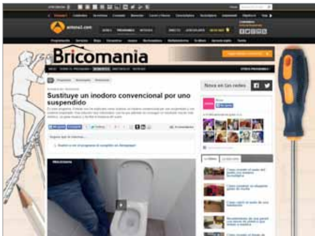
Divulgativos. Bricomania, Nova http://www.antena3.com/programas/bricomania

vos y las docuseries. La relación contraria se ha hallado para los espacios de entretenimiento y humor.