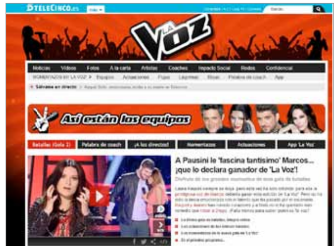
Búsqueda de talentos. La voz , Telecinco http://www.telecinco.es/lavoz

como los factores que tienen un mayor impacto negativo sobre la percepción de calidad.