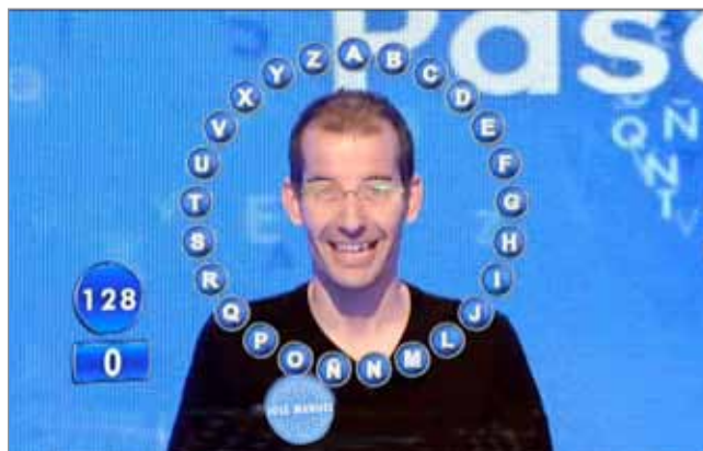
Concurso. Pasapalabra , Telecinco http://www.telecinco.es/pasapalabra

Por tanto hay preferencias por géneros muy dispares. El género preferido, las docuseries, gusta bastante o mucho a casi dos tercios de los espectadores. Sin embargo la telerrealidad es el género menos apreciado, a considerable distancia del resto de contenidos de entretenimiento –sólo gusta bastante o mucho al 12,8%.