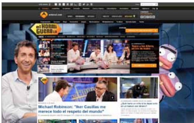
Entretenimiento y humor. El hormiguero , Antena 3 http://www.antena3.com/programas/el-hormiguero