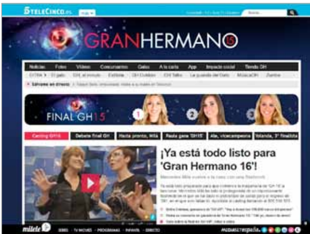
Telerrealidad. Gran hermano , Telecinco http://www.telecinco.es/granhermano