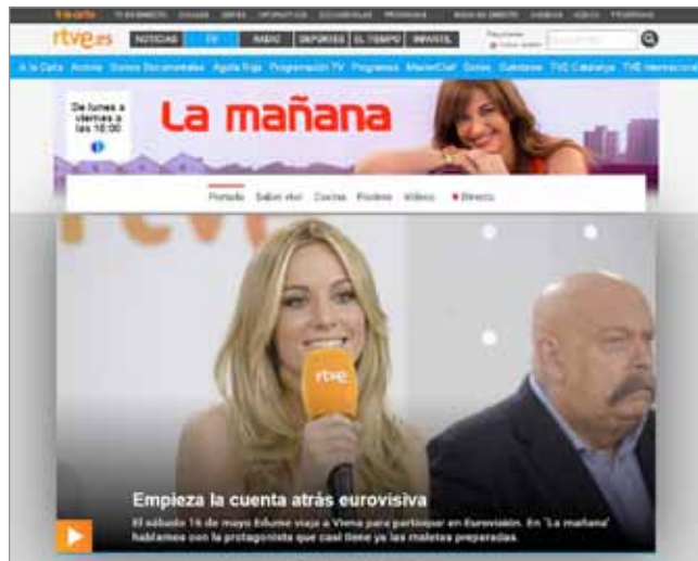
Magazine. La mañana , La 1 http://www.rtve.es/television/la-manana-de-la-1

objetivas, dejando los criterios subjetivos para el análisis de la percepción de la calidad.