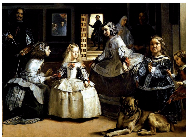
Figura 1. Las meninas de Velázquez

El contenido de la imagen es muy importante a la hora de anotarla para su posterior recuperación. Pero hay situaciones en las que la información visual no aporta todo el contenido de la propia imagen y es evidente que la combinación de la información visual con otra información textual, es beneficiosa para los sistemas de anotación (García-Serrano, 2011). Para lograr una mayor riqueza de anotación, destacamos una línea de investigación a la que cada vez se están dedicando más esfuerzos y será muy relevante en el futuro: la “contextualización de la imagen”. Generalmente, una imagen estará localizada dentro de una o varias webs que tratarán sobre temas relacionados con ella. De esta forma, la contextualización de la imagen analiza las propias webs, en vez de la imagen, y busca obtener un mayor conocimiento del contenido de la imagen además del que se pueda extraer de la misma. Por ejemplo, si se presenta en una web una imagen del cuadro de Las meninas , el sistema de procesamiento visual sabrá que hay un perro, un espejo, varias personas, incluso podría llegar a saber quiénes son las personas. Pero, del texto que rodea la imagen se puede extraer información sobre quién fue el autor, cuándo se pintó, pudiendo reconocer que se trata del cuadro original pintado por Velázquez o la reinterpretación de Picasso.