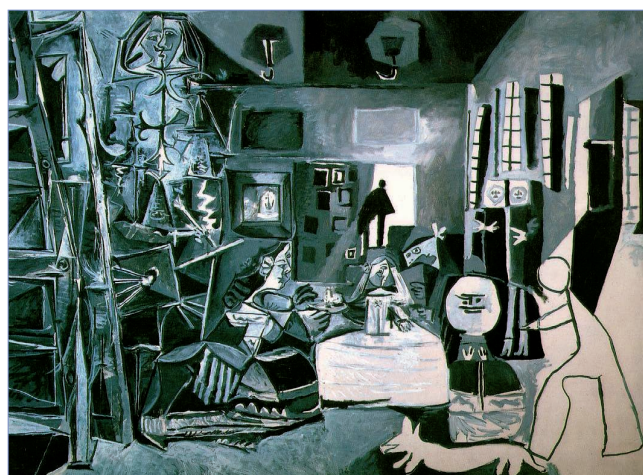
Figura 2. Las meninas de Picasso

Para lograr avanzar en este campo, numerosas comunidades de investigadores están creando bases de datos de imágenes comunes y públicas sobre las que cualquiera pueda realizar pruebas, de tal forma que sea posible establecer